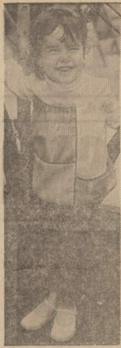
Drabužių gamintojai siūlo jaunuoliams paveikslė matomus drabužėlius. Tvirtina, kad jie labai gražūs ir atviesiam orui labai šilti.

Iš New Yorko, iš New Jersey važiuojančių gausu. Kaip kam ir vietos traukinys pritrūksta atsisėsti. Vakarop visi skuba darbus palikę į savo vasarnamius, kurių čia pakelį gausu. O kiti turi namelius ir žiemavoti. Tas vietos geležinkelis ir verčiasi tais keleiviais ir dar kitas įvairias gėrybes prekniais traukiniais