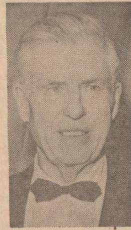
Henry A. Wallace, buvęs Rooseveltto administracijoje JAV viceprezidentas, kurį laika nesveikavęs, mirė Danbury, Conn., ligoninėje.

RIO DE JANEIRO. — Amerikos valstybių konferencijoje, kaip korespondentai praneša, vyksta didelis užkulisinis veikimas Amerika, Brazilija ir kelios kitos valstybės stengiasi prikaltinti delegatus steigti tarptautinę taikos kariuomenę, kuri galėtų būti panaudojama bet kuriam krašte, jei ten įvyktų komunistų revoliucija, ar kaimynų užpuolimas. Daugelis mažesnių valstybių tokios tarptautinės kariuomenės nenori.