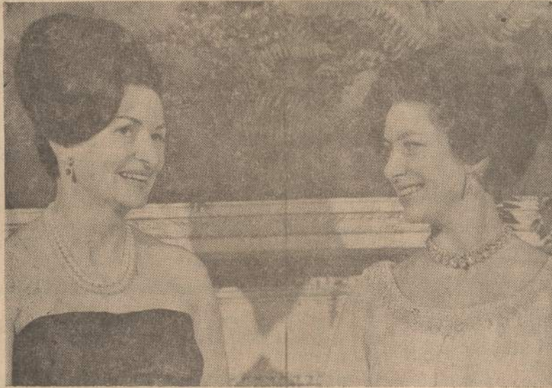
Princesė Margarita (dešinėje) svečiuose pas JAV prezidentą. Čia ji sėdi su prezidento Johnsono žmona, Lady Bird.

MASKVA. — Sovietai paleido antrą raketą į Veneros planetą. Šioje raketoje yra įvairiems matavimams reikalingi instrumentai. Prieš penkis dienas buvo panašios raketa paleista. Stebėtojų nuomone, tas dviejų raketų pasiuntimas rodo, kad vienoje raketoje visi moksliniai instrumentai nesutupo, arba, kad sovietai nesugeba išsauti didesnio svorio raketos, kuri viena pakeltų visus prietaisus.