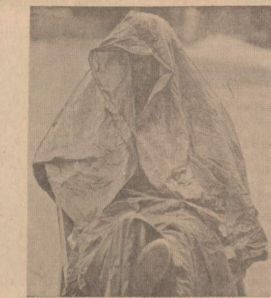
Senos vokiečių tradicijos sako, kad lietus negali sutrukdinti metinio susitikimo medžioklės takuose. Bet šį metų lietus buvo toks smarkus, kad daugelis vokiečių, kaip ir paveiksle matomas, apgalvestavo ejes į susitikimo vietą.

"NAUJIENOS" BOLŠEVIKAMS YRA RAKŠTIS JŲ AKYSE