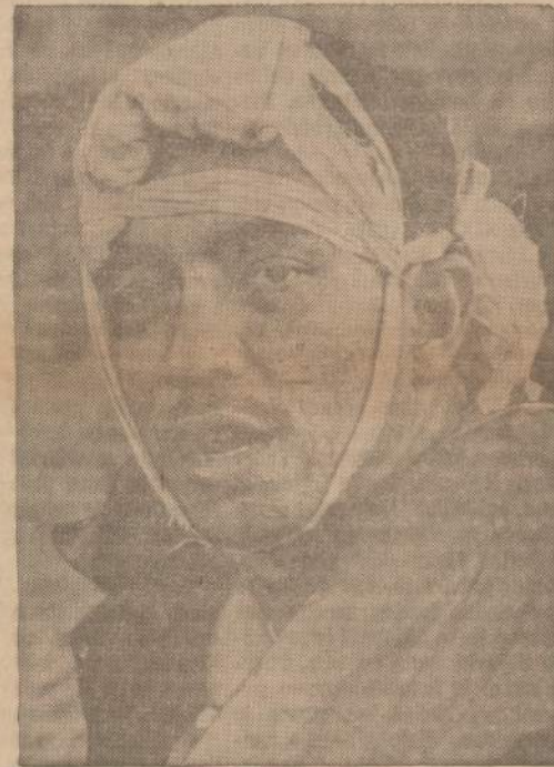
Vietname sužeistas amerikietis karys laukia helikopterio, kurs jį turi išgabenti į ligoninę.

Sako, kad Maskvos piliečiai penktadienio rytą akis išplėtė paskaityt Tasso vienos eilutės žinią, kad Amerikos senatoriai lankėsi pas Sovietų Sąjungos premjerą Kosyginą. Žinutė buvo tokia: "Kosyginas priėmė draugus amerikiečius", bet klaida buvo greičiausiai pataisyta: žodis "draugai" buvo pakeistas "senatoriais".