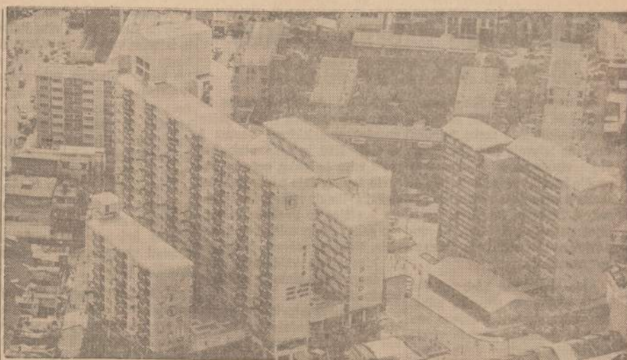
Beį kurį Amerikos miestą primenantis Singaporo miestas prie Malacca priepilaukos pietryčių Azijoje turi penktą didumą pasaulio uostą.