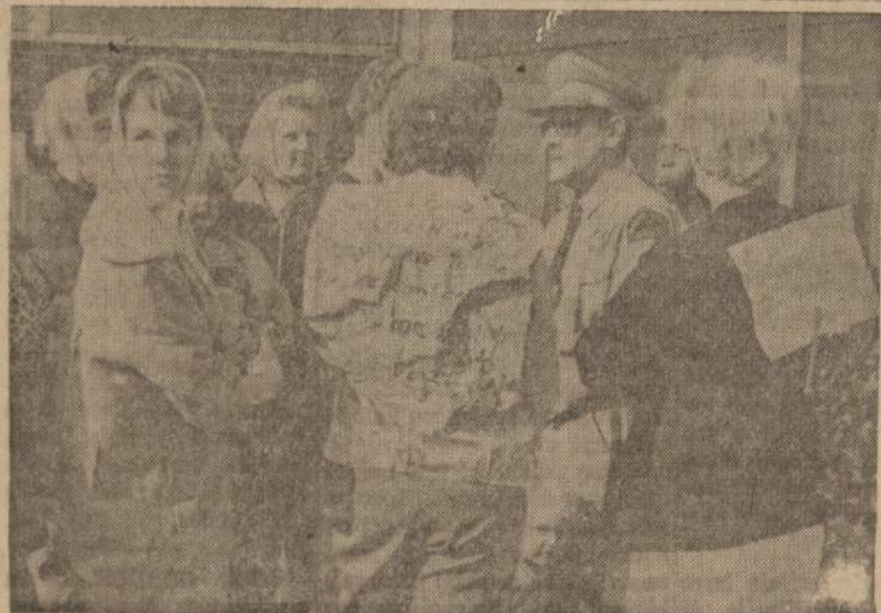
Detroito moterys reikalauja apsaugos nuo užpuoliku, vagių ir prievartautojų. Paskutinėm savaitėm Detroito užpuolimai padažnėjo. Moterys reikalauja ginklų. Jos prašo policijos šefą, kad leistų joms nešiotis revolverius.

VALANDOS: PRIMADIENI . . . . . 12:00 P. M. — 8:00 P. M. ANTRADIENI . . . . . 9:00 A. M. — 4:00 P. M. TREČIADIENI visą dieną uždara. KETVIRTDIENI . . . . . 9:00 A. M. — 8:00 P. M. PENKTADIENI . . . . . 9:00 A. M. — 8:00 P. M. SEŠTADIENI . . . . . 9:00 A. M. — 12:30 P. M.