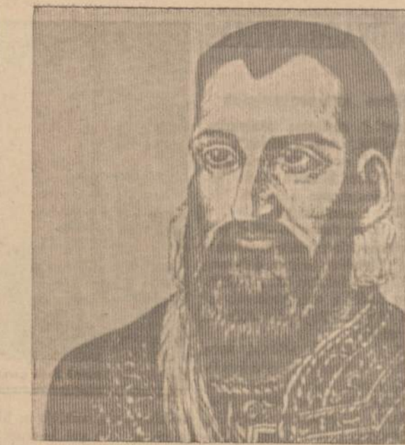
KUNIGAİKSTIS MIKALOJUS RADVILA JUODASIS

Tiesa, Draugas parašė vedamąjį, kur keliamas aliarnas dėl "kultūrininkų grupės", kurie esą pasinėšę bendradarbiauti (užmezgti kultūrinį bendradarbiavimą) su Lietuvos