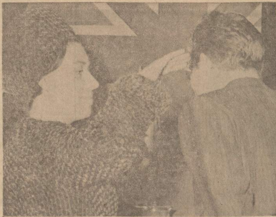
Britų princesė Margarita braukia lietaus laisus nuo savo bekepurio vyro galvos. Apžiūrėjusi idomesnes New Yorko vietas, ji antradienį išskrido į Bermudus salas pailsėti.