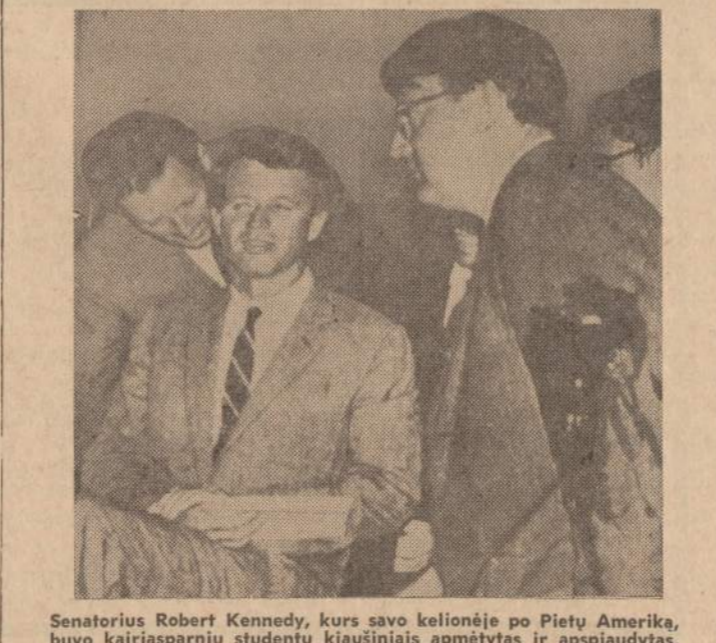
Senatorius Robert Kennedy, kurs savo kelionėje po Pietų Ameriką, buvo kairiasparnių studentų kiaušiniai apmėtytas ir apspaudytas.