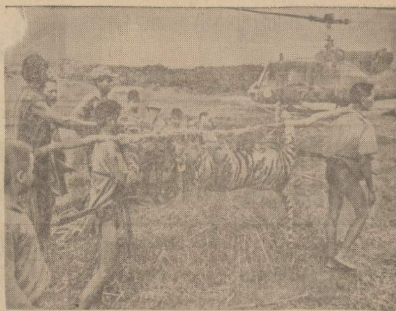
Vietname kariai nušovė figrą, pradėjusi užpildinėti Plei Me apylinkės gyventojus. Nušautas žvėris nešamas į helikopterį, kad būtų galima nuplūsti jo kailį.

Kai ruošiate planus savo ateičiai, turėkite galvoje kaimynystėje esančią finansinę įstaigą — CHICAGO SAVINGS & LOAN ASSOCIATION