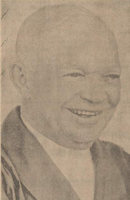
Prezidentas Eisenhoweris, praleidęs kelias dienas Fort Gordon, Ga., ligoninėje, pasikalbėjo su laikraštiniškais apie savijautą ir išvaizdą traukiniu į Washingtoną, kad galėtų baigti gydymą Walter Reed ligoninėje.

Baltųjų Rūmų pareiškimas daugiausiai liečia laikraščiuose pasirodžiusį tvirtinimą, kad atominių ginklų atidavimas sąjungininkams įvykęs be prezidento žinios. Spaudos sekretorius patikino korespondentus, kad prezidentas Johnsonas puikiai žino apie visus gynybos departamentu įvykdytus buvusios sistemos pakeitimus Nato sąjungininkų atžvilgiu. Gynybos departamentas paaiškino, kad devynių Nato sąjungininkų bombonešiai yra ginkluoti atominėmis bombomis, kurias ir toliau saugo Amerikos kariuomenė.