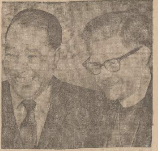
Muzikas Duke Ellington, visą savo gyvenimą grojęs liaudies dainų melodijas, dabar San Francisco mieste pradėjo grofi šventas giesmes.

Naujųjų administracija turi daug gražių ir nebrangių knygų, kurias galima tik už kelių dolerių įsigyti. Knyga yra geriausias žmogaus draugas, tad ir Tamsta įsigyk bent keletą tokių draugų.