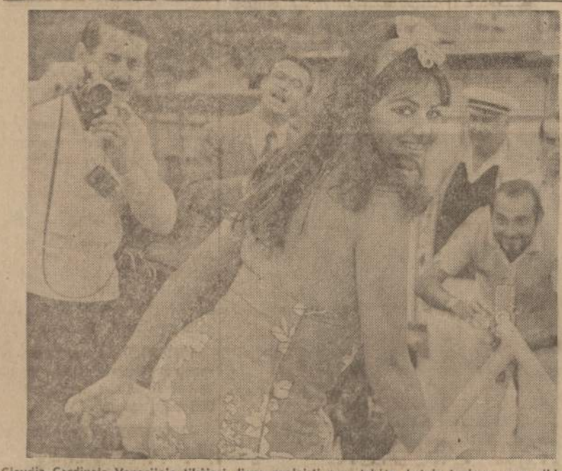
Claudia Cardinale Venecijoje tikėjosi dieną praleisti nepastebėta, bet ją tuojau apsupo didokas fotografų skaičius, kurie nori atminimui turėti josios fotografiją.