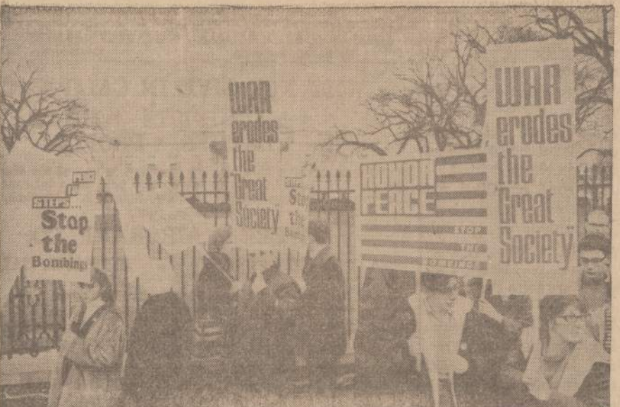
Apie 20,000 žmonių suvažiavo į Washingtoną ir praėję šeštadienį pikietaavo Baltuosius Rūmus. Jie reikalauja, kad prezidentas Johnsonas pradėtų derybas su komunistine Hanoi valdžia dėl karo veiksmų Vietnamo. Dr. Benjamin Spock kalbėjo organizatorių vardu. Amerikos kariai pasipiktinę. Buvo kelios grupės, kurios pikietaavo pikietininkus.

PAUKODAMAS NAUJIEŅŲ MASIŲ FONŲ, ATLIKI DIDELIŲ IR GARBINGŲ DARBŲ. KIEKVIENA DIDELĖ AR MAŽA AUKA BUS TIN KAMAĮ IVERTINTA.