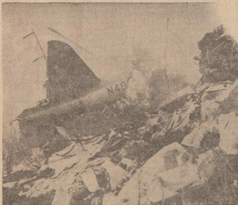
Lėktuvas, iš Salt Lake City vežęs 13 sportininkų į Albuquerque, N. M., nukrito ir užmušė visus keleivius bei įgulos narius. Nelaimė įvyko 20 mylių nuo Salt Lake City.

Praėjusi savaitė buvo labai nuostolinga Pietų Vietnamo kariuomenei. Komunistai apsupo gumos plantacijoje sunaikino višų vietnamiečių pulką. Nemažai žuvo ir keliuose fortuose pajūryje, kur komunistai puolė vyriausybės pozicijas kelių batalijonų jėgomis.