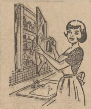
Savo namingai vaistų spintelę reikia nepaprastai svariai ir tvarkingai užlaikyti, kaip šiame vaizdelyje parodyta: išimti visas bonkutes ir išmazgoti lentynas; patikrinti visus užrašus, kad neįvyktų klaidų, nes vaistų sumaišymas gali būti fatališkas, patikrinti, kokiu vaistų trūksta ir juos papildyti kad būtų bent kokian netikėtumui pasirovies.