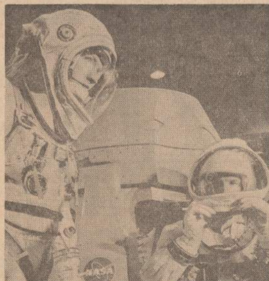
Astronautai Frank Borman ir James Lovell yra pasiruošę skristi keturioliktoji dienų kelionėn į erdvę. Jų sveikata gera, motorai užvesti.

Zambijos "Tshombe" už tai, kad jis pasikvietė baltus britų kareivius.