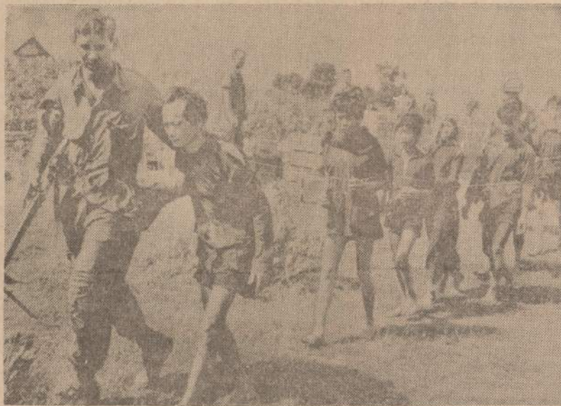
Da Nango srityje mariniams pavyko išvalyti vieną komunistų laikytą sritį. Nelaisvėn paimiti keli komunistai, jų tarpe ir viena moteris, padėjusi komunistams.

RIO DE JANEIRO. — Brazilijoje dideli karščiai daug žmonių susargino. Jau mirė 8 asmenys, o 400 turėjo gulti ligonėn. Jau penkios dienos, kai temperatūra siekia 104 laipsnių.