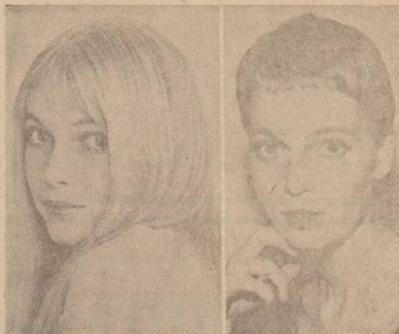
Pradedanti garsėti kino artistė Mia Farrow, susipykusi su sukamo filmo direktorium, niekam nieko nesakiusi, nusikirpo ligus plaukus. Tvirtinama, kad dabar reikės pakeisti filmo tekstas.

Du bepročiai pabėgo iš beprotnamio ir eidamu laukais susitiko mergina. Vienas jų pradėjo taikstyti tą moterį pabučiuoti. "Iš proto esi išėjęs!" sušuko mergina besigindama, — "Bėkim!" sušuko antrasis, "Matai, kad mus pažino!"