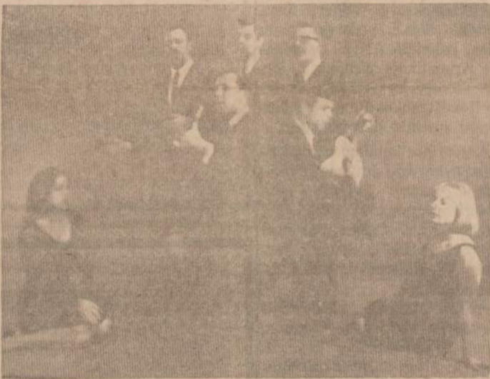
"Antrasis kaimas" repeticijos metu.