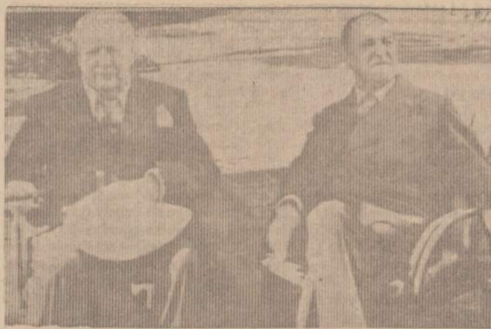
Rašytojas Somerset Maugham su draugu Winston Churchill. Abu užkandžiauja S. Maugham vilos terasoje 1959 metais.

Winstono Čiurčilio, taip pat mirusio sulaukus gražios senatvės, draugas. Payžmėtina, jog velionis rašė ir kūrė, anaipol, ne iš kokio nors idealizmo ar filosofinių priežasčių, bet tam, kad pasidarytų turtingas. Šio fakto — ir jis pats niekam ir niekad neslėpęs. Dar viena svarbi smulkmena pridurtina — Somerset Maugham niekad nenaudojo rašomosios mašinėlės. Visus savo kūrinius jis parašė ranka ir daugiausia savo kūrinių yra sukūręs rytais — laikotarpyje tarp pusryčių ir pietų. Per tą laiką jis parašydavęs tarp 1,000-1,500 žodžių ir tie žodžiai — būdavę pakankamai brandūs, naudotini jo kūrybai.