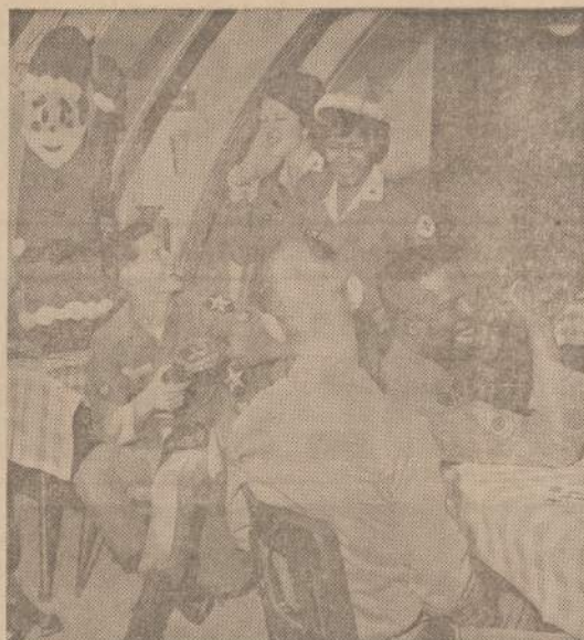
Iš fronto linijų sugrįžę Amerikos kariai Vietnamo užfrontėje gražiai praleidžia laisvalaikį. Pavakais matome dvi Raudonojo Kryžiaus tarnautojas, dainuojančias linksmiems karius.

Kita vietovė — dzūkų Varėna (Merkio ir Varėnės santakoje). Be kita ko, ir ši vietovė susijusi su kariuomene: carų laikais rusai čia buvo įrengę Vilniaus