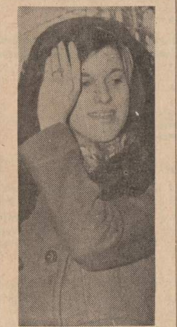
Lucie Johnson, švenčių metu susižiavusi su Pat Nugent, rodo sužiedotųjų žiedą. Vienai dienai jiedu buvo atskridę į Waukeganą, Ill.