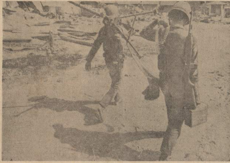
Amerikos kulkosvaidininkai. Kalėdų dieną atmuše puolusius komunistus, žygiuoja į Than Phu-long kaimelį. Priešas atmuštas ir priverstas trauktis toliau į kaimus.

LIVERPULIS. — Britų laivų statykla suprojektavo naujo tipo prekinį laivą, kuris galės atsilpnimo. Bet koks didesnis smūgis galėtų Kiniją visai sužlugdyti ir sugriauti dabartinę valdžios sistemą.