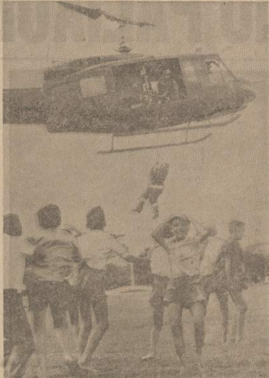
Amerikos karo vadovybė Vietname pasiuntė keletą helikopterų kaledinėms dovanoms išvežti. Pavelskite matome vaikus, laukiančius kaledų senelio su dovanomis.

Vyr. Skautininkas prašo vadovus LSB vienetu šūkius 1966 m. stovyklose, sveigose, šventėse ir kitur pritaikyti prie šio mums bendro tikslo.