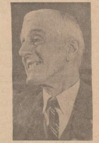
Respublikonų senatorius Leverett Saltonstall, sulaukęs 73 metų amžiaus, pareiškė, kad jis jau neįsivaikš senatoriaus vietos ateinančiuose rinkimuose.

BOSTONAS. — Senatorius Leverett Saltonstall, Massachusetts respublikonas, sulaukęs 73 metų amžiaus, pasitraukė iš savo posto senate.