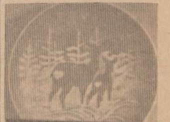
SKAITYK IR KITAM PATARK SKAITYTI "NAUJIENAS"

Taigi, prosit laimingų Naujų Metų! J. P.