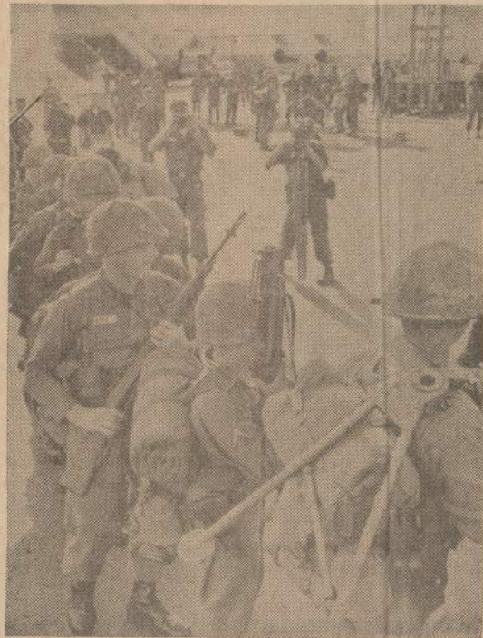
Apmokyti JAV kariai iš Havajų salų lėktuvais skrisdinami tiesiai į Vietnamą. Paveiksle matome karius, išlipančius iš mižiniško srausminio lėktuvo.

PRAGA. — Čekoslovakų žinių agentūra pranešė, apie jaunimo sukeltas riaušes Pragos bažnyčioje Kalėdų išvakarėse. Jaunimas norėjęs išardyti pamaldas ir tam panaudojęs net sprogėjančius fajervėkus.