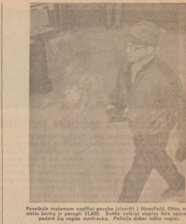
Paveiksle matomam vagiliui pavyko įsiveržti į Mansfield, Ohio, miestelio banką ir pavogti $1,600. Banke veikias slapta foto aparatas padarė šią vagies nuotrauką. Policija dabar ieško vagis.