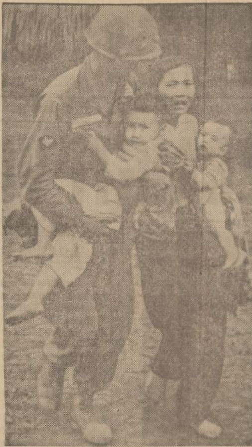
Amerikos parašutininkas veda vietnamietį ir jos vaikus iš komunistų mirtarų apsaugomos vietos. Komunistai puolė amerikiečių artilleriją Vun Tau srityje.