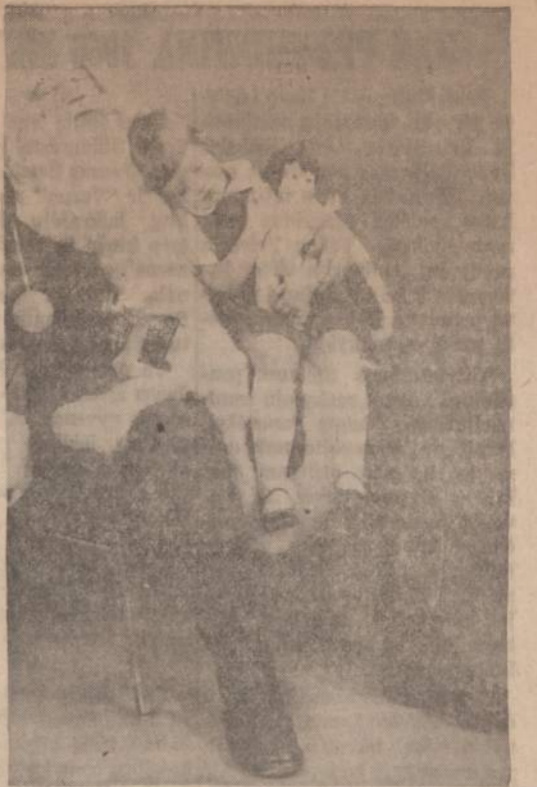
Kalėdų senelis, apdovanojęs paskutinį lankytoją Allentown, Pa., krautuvėje, nutarė gerai pailsėti, nes prieš šventes jam teko labai išvargti.

Toje pačioje brošiūroje apie "Dvi Taktikas", Leninai aiškino, kad turi būti sudaryta Liaikina Vyriausybė, kaip žingsnis į demokratines respublikas steigimą. Ji turėsianti suaukšti