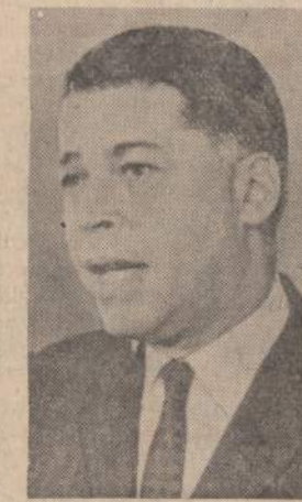
Edward Brooke, dabartinis Massachusetts valstybės ginejas, paskelbė, kad jis kandidatuos į JAV-bių senatoriaus pareigas. Jeigu būtų išrinktas, tai Brooke būtų pirmas nepras senatorius. Jis nori kandidatuoti vietoje sen. Saltostall.

ČIKAGA. — Naujų Metų balnuje Park Manor Bowling centre 27 asmenys apsinuodijo maistu.