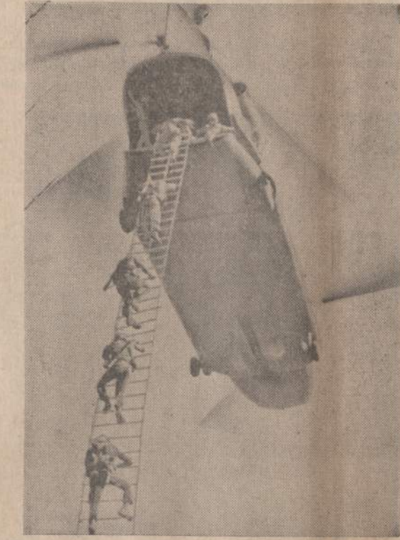
Amerikos helikopteriai Vietname jau turi kopėčias, kad greičiau įliptų į mašiną. Vietomis helikopteriai negali nusileisti, tada jis nuleidžia kopėčias.

Jos dalyviai stebėjo Kubos revoliucijos šventės parodą, kuriame Castro pademonstravo savo iš sovietų gautus ginklus.