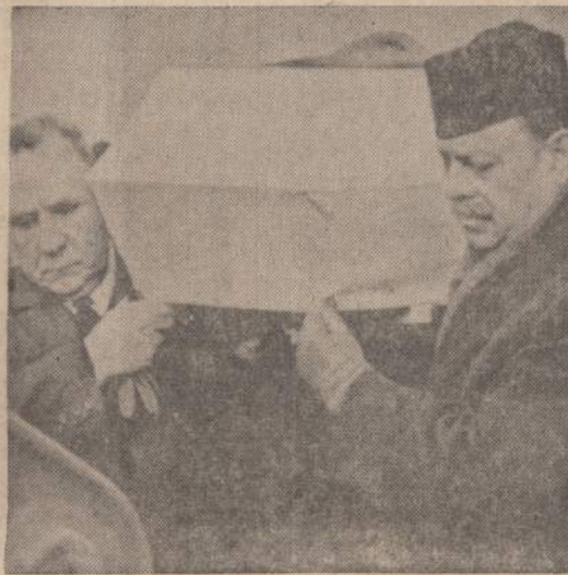
Sovietų premjeras Kosyginas ir Pakistano prezidentas Ayub Khan neša Indijos premjero šastri palaikus į lėktuvą. Indijos premjeras, grįžęs iš Kosyginu suruošto banketo, prigūbė, bet ligai negalėjo gulėti. Staigiai užėjo kosulys, kuris smėnė širdies priepuolį.

◆ Sovietų radijas, komentodamas prezidento Johnsono kalbą, daugiausia pareiškė nepasitenkinimo ta vieta, kur prezidentas kalbėjo apie tvirtą nusistatymą nepalikti Pietų Vietnamo komunistų agresijos malonei. “Tass” sako, kad Amerika siekianti ginklo pagalba primesti vietnamiečiams savo valdžios sistemą.