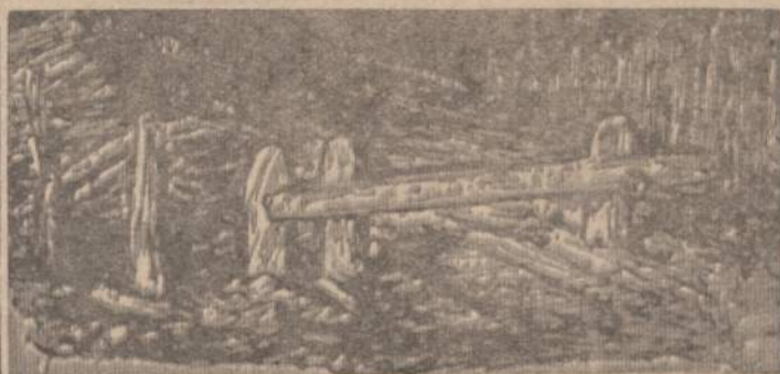
Užverta gatvė... į laisvę