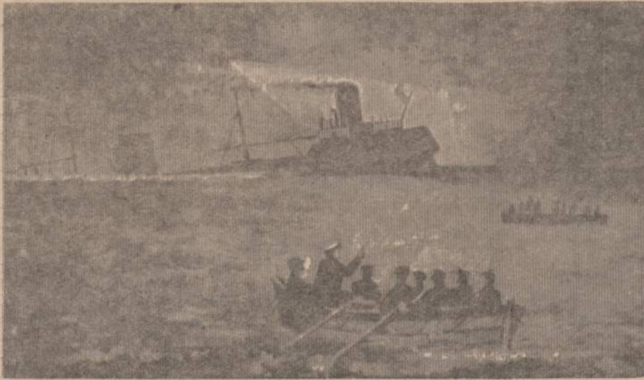
„...Laivas jau matomai savo priekiu sėdasi į vandenį vis gilyn ir gilyn. Laivo užpakalyje buvusi dinamoma mašina veikė iki paskutinio akimirksnio ir apšviesta mūsų trispalvė paskutinė nusileido jūros karalijon...“