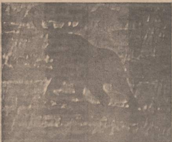
BUVUSIO LAISVO PAJŪRIO LAISVAS GYVENTOJAS

Lietuvos Saharose arba Kuršių Užmarije iš senų laikų gyveno gausi elnių plačiaragių, kitų briedžių vadinamų, šeima, kurios vienas stambus, senesnio amžiaus narys, buvo tiek prie žmonių prijunkęs, kad palikęs savo kaimenę atėdavo į pajūrio maudyklės su vasarotojais "pasimaudyti". Atrodo, kad vaizdelyje matomas yra tas pats senas pažįstamas, su malonumu bebraidas putotose Baltijos bangose. Lietuva ir Lietuvos pajūrį burliokams su "kaifušomis" užplūdus, kažin ar nors elniams be ypatingų leidimų bėra leidžiama gyventi savo rezervate.