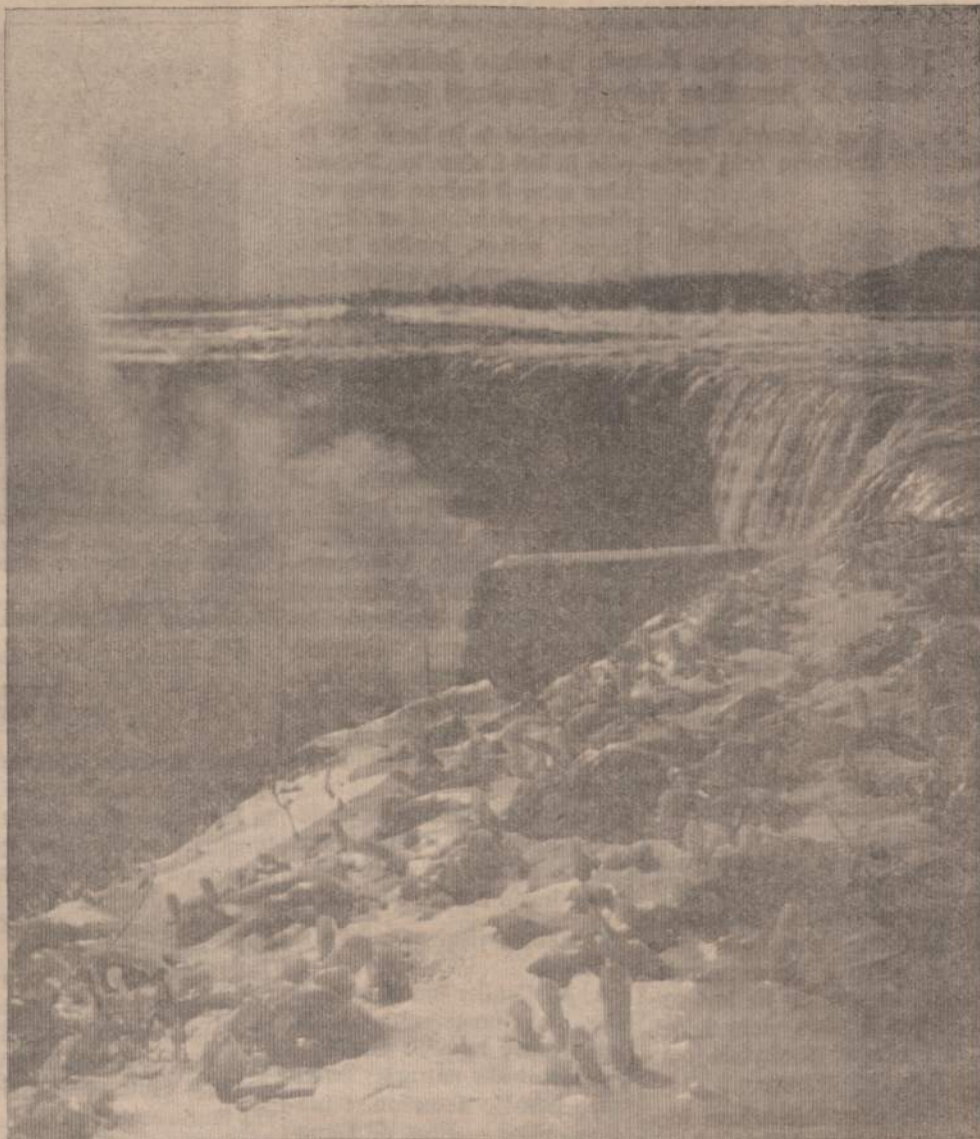
AUŠRA VIRŠUM NIAGAROS KRIOKLIO

6 — NAUJIENOS, CHICAGO 8, ILL. — SATURDAY, JANUARY 15, 1966