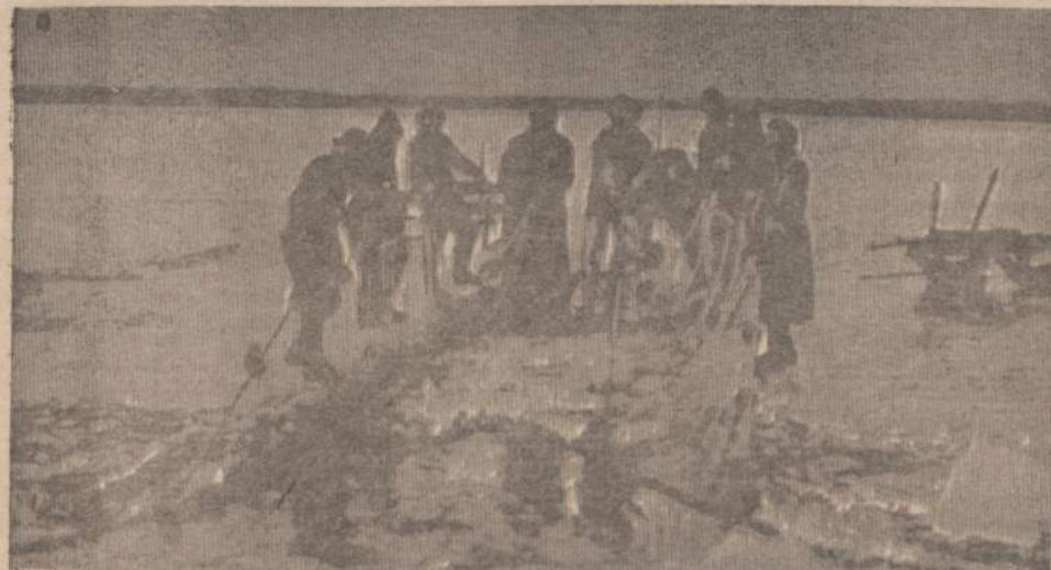
ZVEJYBA PO LEDU KURŠIŲ MARIOSE

Milanas. — Italijos viešbučio vedėjas pasiskundė policijai, kad 56 asmenų komunistinės Kinijos artistų grupė paliko viešbutį neužsimokėjusi sąskaitos, kuri siekia 8,000 dolerių.