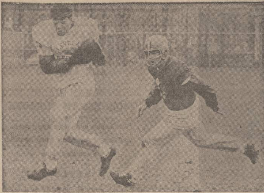
Praeiti sekmadienį Green Bay, Wis., sporto aikštėje žaidė Clevelando žaidėjai su vietiniais. Matome vieną žaidimo momentą.

Žinoma, kaip ir visur kitur, taip ir pas mus buvo neįmanoma