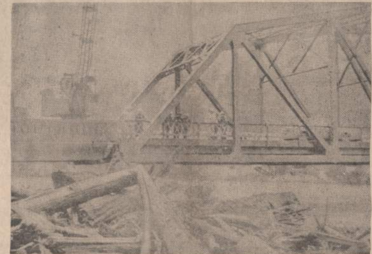
Po smarkaus lietaus pakilo Kalifornijos upės. Orick, Cal., srityje susidarė pavojus, kai pakilęs vanduo suvilko daug medžių ir kitokios medžiagos. Paupliuose gyvenusieji žmonės persikėlė į aukštesnes vietas.

OTTAWA. — Šiais metais Kanados gyventojų skaičius pasieks 20 milijonų. Spalio mėnesį buvo 19,705,000 gyventojų.