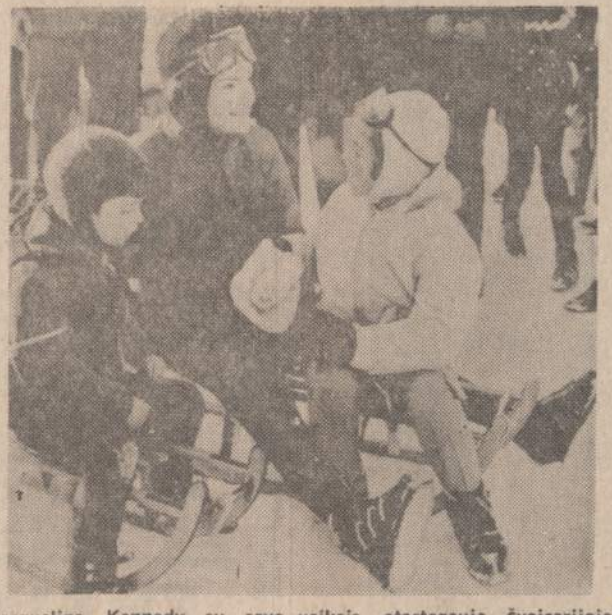
Jacqueline Kennedy su savo vaikais atostogauja šveicarijoje, Gstaade apylinkėse. Ji labai nepatenkinta suvažiavusiais korespondentais ir fotografais, neleidžiančiais jai žingsnio žengti. Atrodo, kad fotografai nustojo ją persekioti.

W. 64th St. ir Vakariniėje dalyje 5817 W. Madison St.