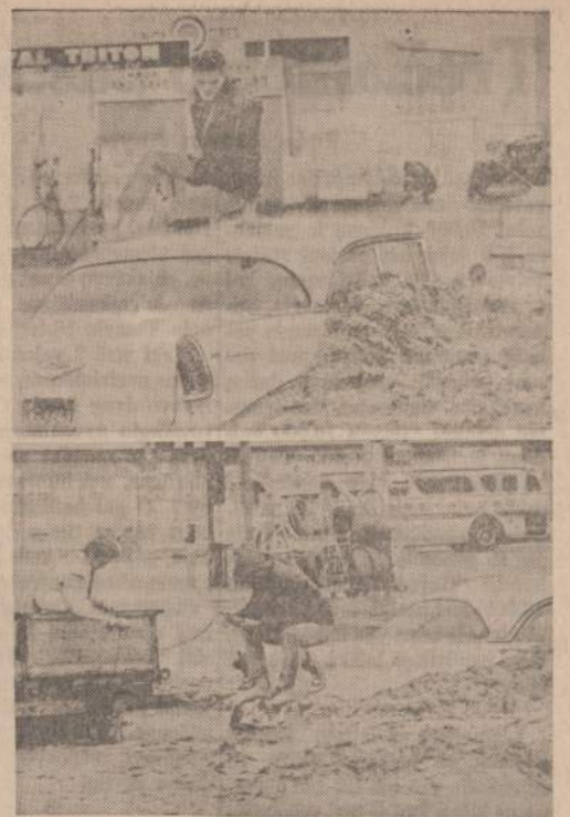
Smarkus lietus Kalifornijoje apsmė gatves ir aptvindė automobilius. Vairuotojas turėjo (viršū) lipni ant stogelio. Vėliau atsiradęs sunkvežimis padėjo išvilkti apsmėtą mašiną.