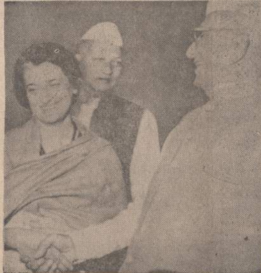
Indijos finansų ministeris M. Desai nenorėjo, kad Indira Gandhi būtų išrinkta Indijos premjeru. Kongreso partijos posėdyjeose jis sake kalbas prieš jos paskyrimą tokioms atsakomingsoms pareigoms. Bet kai daugumas vis dėlto ją išrinko, tai Desai pirmas į pasveikino ir pasiūžėjo bendradarbiauti.

BELGRADAS. — Jugoslavijoje nuo alkoholio apsinuodijimo mirė 11 asmenų.