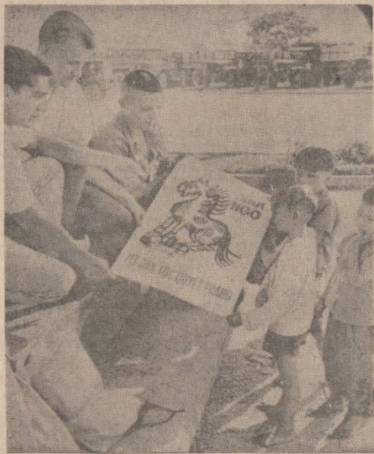
Vietnamo jaunuoliai atnešė Amerikos ir Australijos kariams vaikų pieštą arkli. Arklys treplena įsiveržusius komunistus. Be to, arklys yra prasidėjusių naujų metų simbolis. Vietnamiečiai mano, kad šis arklys šiais metais padės jiems laimėti kovas prieš komunistus.

Amerikoje iš 192 milijonų tik 5 milijonai dirba ūkyje ir Amerika ne tik pati gerai maitinasi, bet dar šeria žmones kituose kraštuose.