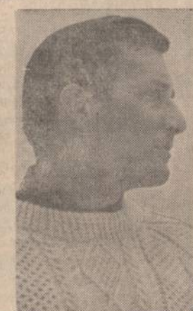
J. D. Rockefeller IV, 18 mėnesių diri- bes socialinėje srityje, pareiškė, kad jis bus demokratų kandidatas į West Virginia atstovų rūmus. Kiti jo gi- minės nariai priklauso respublikonų partijai, bet jis yra įsitikinęs demo- kratas.

Praėjusios savaitės šalčiai ga- li pakelti daržovių kainas, nes iš Floridos dideli kiekiai nepateks į krautuves. Daržovių stoka gali užsistėti iki balandžio mėnesio.