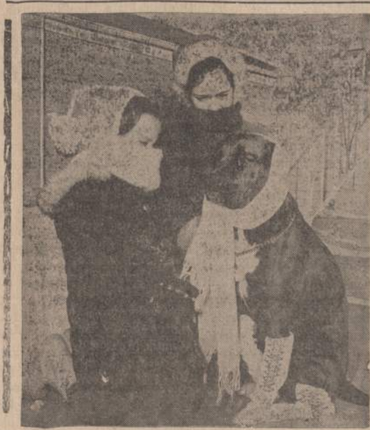
Paspaudus stipresniems šalčiams, pavojinga ir šunį pavaduoti. Pa-velksle matome du žikagiečius, šalčio metu išvedusius savo šunytį. Jie du ne tik patys apsiraišiojo, bet ir savo šunytį apraišiojo.