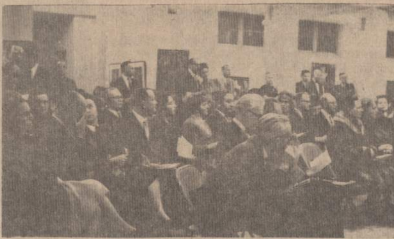
Bendras vaizdas iš Jono Rimšos parodos atidarymo Čiurlionio galerijoje sausio 29 d.