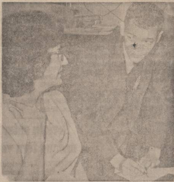
Negras Julian Bond, negavęs teisės būti Georgio seimo nariu dėl keistokos jo pozicijos Vietnamo karo klausimu. Georgia valstijoje bus specialios rinkimai vakancijai užpildyti. Julian Bond nori dar kartą kandidatuoti.

Šita moteris, 1830-31 m. sukilimo dalyvė, yra aprašyta Liet. Enciklopedijoje 23 tome. Štai kaip ją, kaip asmenį,