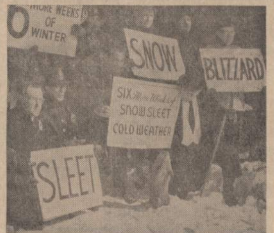
Punscutawney, Pa., drąsūs oro spėjimai susirinko patikrinti, ar išlindęs kurnis jau gali pamatyti savo šešalį. Diena pasitaikė debesuota ir šešėlio nesimatė. Pranašai paskelbė, kad per 6 savaites bus gana blogos oras.

Pirmasis: — Naujiena! Ir kas buvo tas laimingasis?