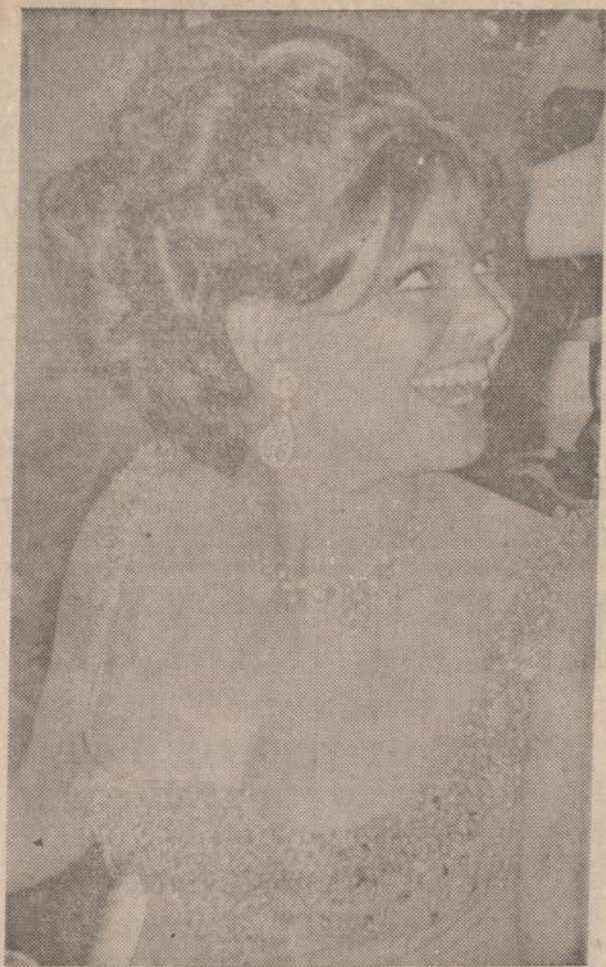
Kino artistė Claudia Cardinale labai patenkinta Hollywoodo Užsienio Spaudos Draugijos jai suteiktu Aukšiniu Rutuliu už geriausią praeitų metų vaidinimą. Ji gavo kelis pažymėjimus.