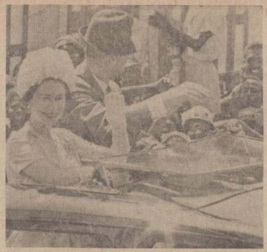
Anglijos karalienė lanko britų Gvianą. Karališkąją porą pasitiko didelės minios gyventojų. Gvianos sostinės gatvėmis karalienė važinėjo atdaru automobiliu.

● Reikia daug daugiau žinoti, kol pradeda žinoti, kad tiek mažai težina.