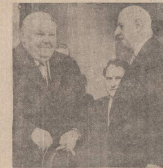
Vokietijos kancleris Erhard atvyko į Paryžių, kad galėtų išsiaiškinti su gen. Charles de Gaulle, kuriais sumetimais jis rengiasi vykti į Maskvą.

— Ukmergės rajone septyniems ypatingai uoliams Veprių kolchozo darbininkams specialistams pastatydino po namą išsimokėtinai. Turėjo įmokėti 20%, kita išsimokėsia per 10 ar 15 metų. Namai trijų kambarių ir virtuvės, su elektra. Kaina ne-nimima. (E)