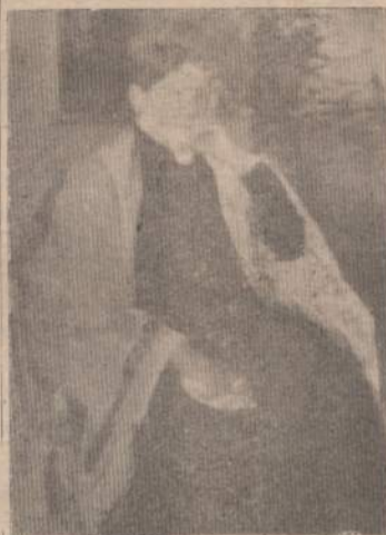
Mary Cassatt — Motinos portretas

Viena iš garsiausių moterų dailininkių Mary Cassatt, mirė Paryžiuje 1926 metais sulaukusi 81 metų amžiaus. Ji gimė 1845 m. Pensilvanijoje, netoli Pittsburgho. Išvykusi į Paryžių mokytis dailės, tenai ir pasiliko iki mirties. Į JAV tik porą kartų buvo atvykusi su savo giminėmis pasimatyti.