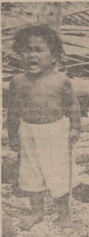
Per Samoa salas praužė nepaprastai stiprus uraganas. Jis nugriovė namus ir nusinešė į nežinią apie 20 gyventojų. Tėvų ir namų netekę našlaitis verkia.

Ispanams XVI amžiuje užkariaujant Meksiką, buvo apie 250 indėnų kalbų ir tarmių, iš kurių daugiau kaip 60 visiškai išnyko. Išlikusios yra 33 skirtingos indėnų kalbos grupės.