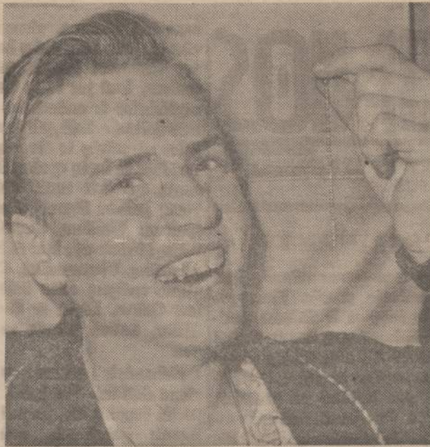
Prieš kelis metus paveiksle matomas jaunuolis prarijo 6 colių rėželį. Tas rėželis pateko į apendiksą ir apaugo. Jam buvo padaryta operacija ir ilgus metus išnešiotas rėželis išimtas.

"Niekas dar nežino, dėlko tas laikotarpis tarp pusės ir pusantų metų yra tiek svarbus žmonėms emociniam išsivystymui suaugus", sako doktoras, nes iki pusės metų ir po pusantų metų vaikas motinos nebuvimą ar jos nervuotą nuotaiką "gana lengvai" pakelias.