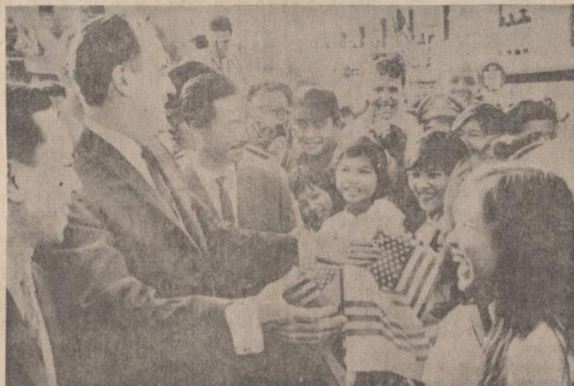
Viceprezidentas Hubert H. Humphrey kartu su Vietnamo premjeru Cao Ky Saigone kalbasi su mokyklos mokiniais. Viceprezidentas įpareigoja susitari su Vietnamo vyriausybe dėl konkrečių pagalbos priemonių gyventojams.

gai kovoti prieš JAV imperializmą galima tik griežtai ir aiškiai atsiskyrus nuo chruščiovinių revizionistų ir paskelbus jiems griežtą pasipriešinimą iki laimėjimo.