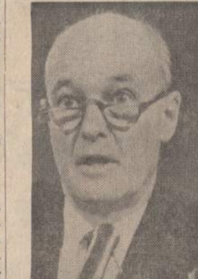
Buvęs JAV diplomatas George F. Kennan liudija senato užsienio komitete. Jis pataria rasti būdą likviduoti Vietnamo konfliktą ir jokiū būdu neįtraukti į karą Azijoje.