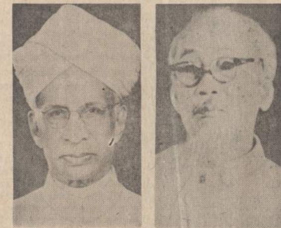
Šiaurės Vietnamo komunistų vadovai Ho Chi Minh (dešinėje) pasiuntė laisvą Indijos prezidentui Sarvepalli Radhakrishnan, prašydamas, kad padėtų siekti taikos Vietname. Bet savo laisvę jis ir vėl reikalauja atšaukti JAV karo įsąs iš pietų Vietnamo, bet pats nepasidėd atšaukti ginkluotų komunistų iš pietų Vietnamo.

ros prispaustas sovietų gyventojas vargu gali tikėtis, kad šitokią padėtį pakeis ir naujasis penkmečio planas.