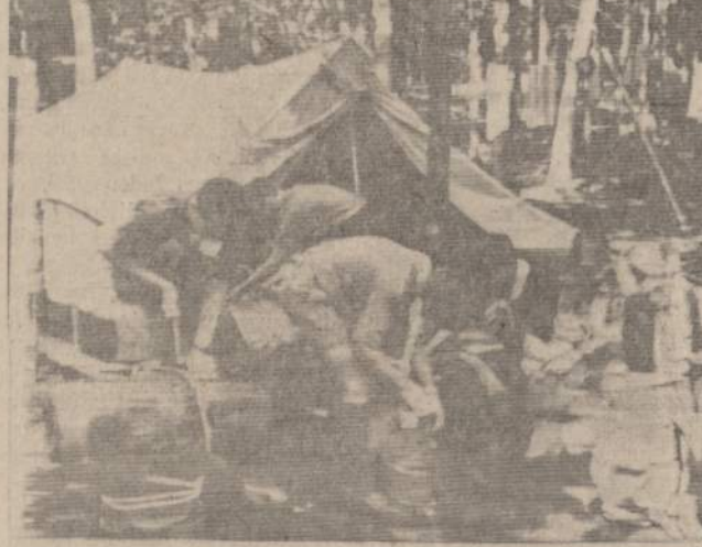
MALONŲ VASAROS ATSIMINIMAI MUS SKATINA IR SIEMETINĖMS STOVYKLOMS Čia matome "Žirgų" skiltį LSS-gos vadovu-ly "Tėviškės" vardo stovykloje (Kanadoje 1965 m.), besiruošiančią į 24 valandų žygį.

Mūsų skautiškoju keliu važiuoja milijonai jaunų ir jau paaugusių visokių tautybių, visokių religijų ir visokių rasų žmonių. Visi jie susitinka, sveikinasi, šypsoi ir broilais-sesėmis vadinasi. Skautas vytis D. Dainutis