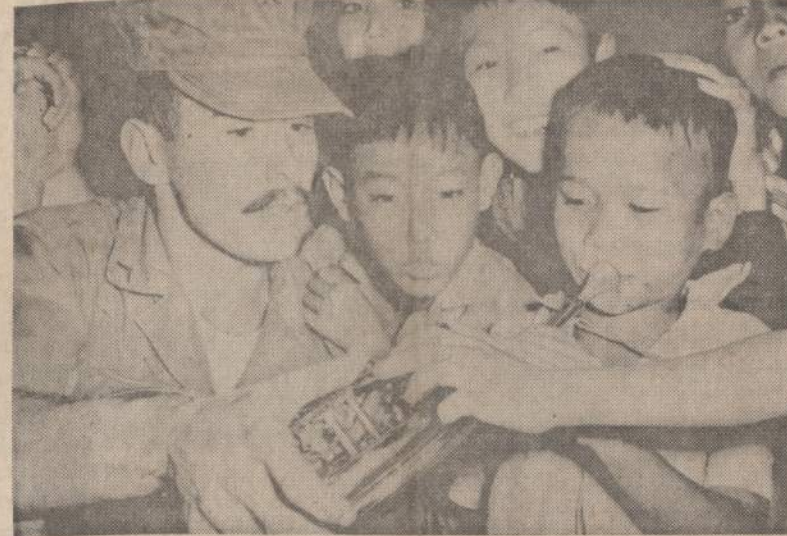
Amerikos marinas mokina Da Nango vaikus, kaip ūsti ragą. Mokslo metų pabaigoje buvo pakviesti mariniai pagroti. Vaikams muzika tiek patiko, kad laisvalaikiu marinal dabar turės mokytį vaikus groti.

Aukšto Egipto pareigūno atvykimas simbolizuoja vis gerėjančius tarp abiejų valstybių santykius. Washingtone tikima, kad ateietyje tie santykiai gali dar pagerėti, nors jiems trukdo Izraelio klausimas.