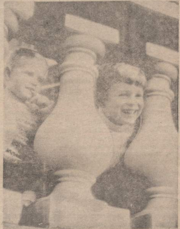
Britų princai Edvardas ir Andrius iš Buckingham rūmų balustrados žiūri į praeivius. Tai jaunesnieji karalienės Elzbietos vaikai. Edvardas yra keturių metų, o Andrius jau netrukus minės savo 6 gimtadienį. Vaikai atrodo sveiki ir linksmi.

apinasriniai varžtai rašytojams ir vėl daugiau suveržti. Kaip žinome, pasaulyje pagarsėjo du sovietiniai rašytojai — žinomas literatūros kritikas Andrej Sinjavskij ir vertėjas Yuri Daniel. Jų garsas iškilo todėl, kad jie, nežinomais keliais, išsiuntė savo kūrinius į Vakarų pasaulį, kur jie buvo išspausdinti ir turėjo ypatingai gerą pasisekimą. Sinjavskij, pasirinkęs slapyvardį Abram Tertz, parašė “Liubimov”, kuri Vakaruose buvo pavadinta “The Makepeace experiment”, o Daniel — parašė knygą, pavadintą “Moscow calling”. Abiejose knygose, tikro socialistinio realizmo formoj, liečiami politiniai dalykai. Tertzas aprašo dviračių mechaniką, kuris Liubimow mieste išradęs būdą kontroliuoti žmonių galvojimą, bando grįžti prie senų gyvenimo normų. Gi Daniel knygoje — rašoma apie vyriausybės įstatymą, kuriuo leidžiama viena diena metuose... žudyti žmogui žmogų. Tuo pasinaudodami gyventojai, esą, pradeda suvedinėti sąskaitas vieni su kitais.