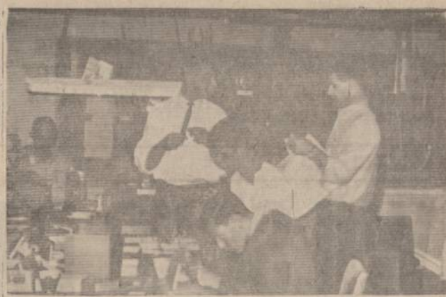
Lituanicos skautų tunte vyrai darbo metu, besiruošdami Kaziuko mugelį