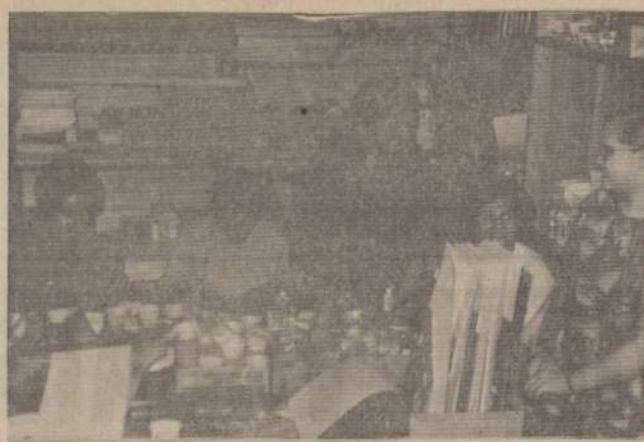
Lituanicos skautų tunte nuodirdžios talkininkės ruošia Kaziuko mugelį dovanas.