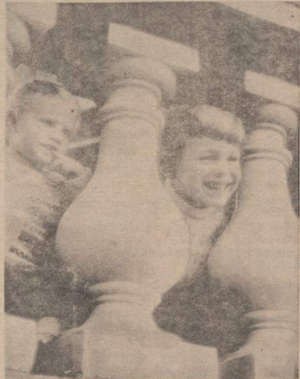
Britų princas Edvardas ir Andrius iš Buckingham rūmų baliustrados žiūri į praeivius. Tai jaunesnieji karalienės Elzbietos vaikai. Edvardas yra keturių metų, o Andrius jau netrukus minės savo 6 gimtadienį. Vaikai atrodo sveiki ir linksni.

apinasriniai varžtai rašytojams ir vėl daugiau suveržti. Kaip žinome, pasaulyje pagarsėjo du sovietiniai rašytojai — žinomas literatūros kritikas Andrej Sinijavskij ir vertėjas Yuri Daniel. Jų garsas iškilo todėl, kad jie, nežinomais keliais, išsiuntė savo kūrinius į Vakarų pasaulį, kur jie buvo išspausdinti ir turėjo ypatingai gerą pasisekimą. Sinijavskij, pasirinkęs slapyvardį Abram Tertz, parašė "Liubimov", kuri Vakaruose buvo pavadinta "The Makepeace experiment", o Daniel — parašė knygą, pavadintą "Moscow calling". Abiejose knygos, tikro socialistinio realizmo formoj, liečiami politiniai dalykai. Tertzas aprašo dviračių mechaniką, kuris Liubimow mieste išradęs būdą kontroliuoti žmonių galvojimą, bando grįžti prie senų gyvenimo normų. Gi Daniel knygoje — rašoma apie vyriausybės istatymą, kuriuo leidžiama vieną dieną metuose... žudyti žmogui žmogų. Tuo pasinaudodami gyventojai, esą, pradeda suvedinėti sąskaitas vieni su kitais.