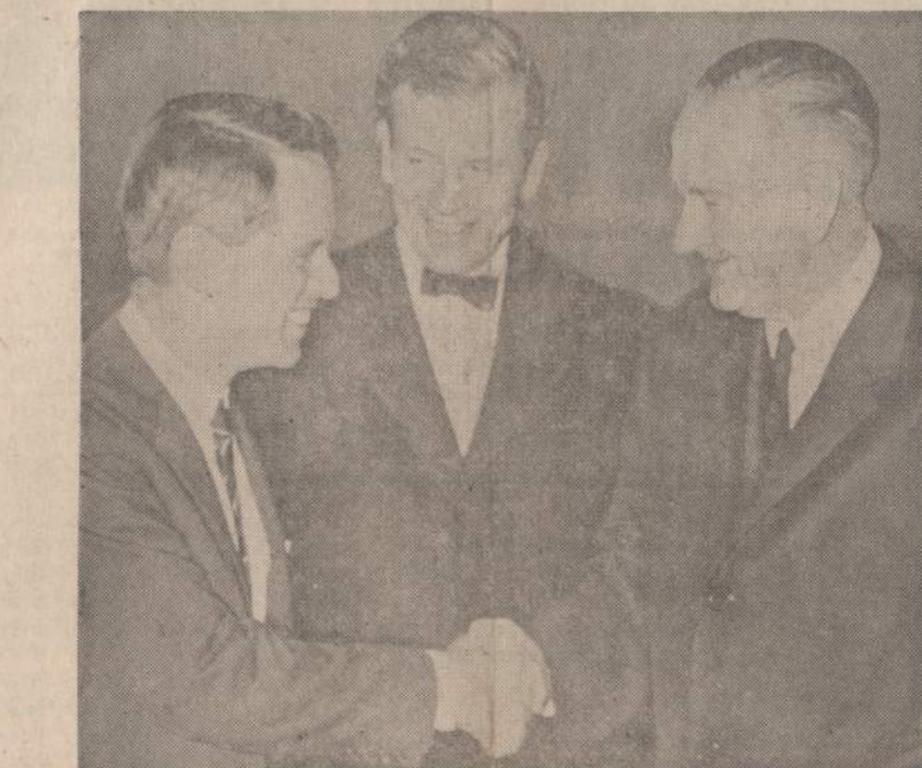
Senatorių Robert F. Kennedy ir New Yorko mэрas John Lindsay sveikina prezidentą Johnsoną, atvykusį į New Yorką kalbos sakyti. Senatorius Kennedy aiškino prezidentui, kad savo pareikime jis netiksliai savo mintis buvo išdėstęs.

MIAMI BEACH. — Amerikos darbo unijų federacija ragina vyriausybę uždėti didesnius mokesčius nepaprastai dideliems biznio bendrovių pelnams. Federacija sako, kad Vietnamo karo išlaidos neturėtų būti užkrautos ant nepasiturinčiųjų piliečių pečių, bet ant milžiniškų korporacijų, kurių vis didėję pelnai prisideda prie infliacijos. Federacija nurodo, kad laisvos Amerikos bendruomenės ekonominis stiprumas yra geriausias ginklas prieš komunizmo plėtimąsi.