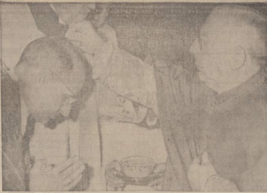
Italų kardinolas Marella Pelenu diena beria pelenus ant popiežiaus Pauliaus VI galvos. Popiezius paskelbė kelias lengvatas katalikams gavėnios metu, bet jis nori, kad jie daugiau melstųsi.