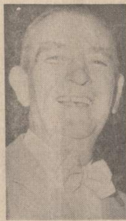
Kongreso atstovas Albertas Thomas, 67 metų amžiaus sulaukęs Texas demokratas, staigiai mirė. Jo vietą užimti Texas valstijoje bus labai sėdri rinkiminė kova.

Delegacija tais pačiais reikalais pasikalbėti dar apsilankė pas senatorių Paul H. Douglas (D., Ill.), atst. Edna F. Kelly (D., N. Y.) ir atst. John D. Dingell (D., Mich.). Ir čia buvo aptarti opiejį pavergtųjų Europos tautų klausimai. (E)