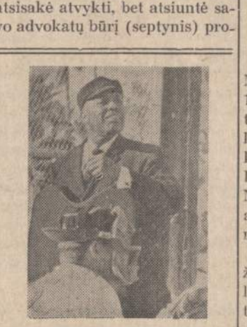
Negras Emmett Ashford Anaheim, Cal. saka žaidimą. Jis yra pirmas negras, paskirtas teisėju. Jam teks dirbti kartu su Amerikos Lygos žaidėjais.