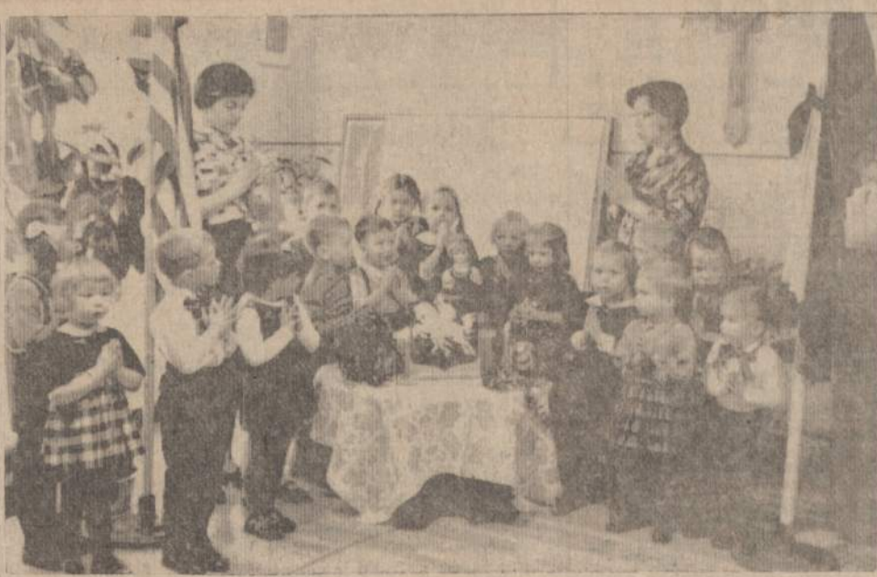
Po vėliavos, perrištos juodu kaspiniu, pakėlimo Vasario 16 d. proga, kalbama malda už kovoję žuvusius — AL Montessori Draugijos Vaikų Namuose.

Laisvos Lietuvos idėjos sklaidimas tarp savųjų, laisvėje gyvenančių lietuvių tarpe, yra gra-