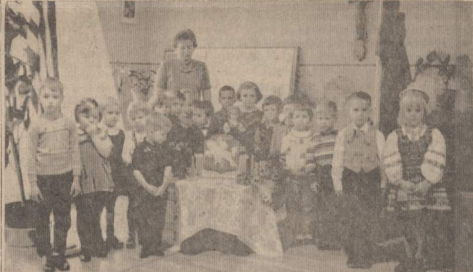
Švenčiame Vasario 16 dieną Amerikos Lietuvių Montessori Vaikų Namuose, popietinė grupė.