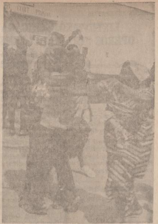
Iš prezidentūros pavarytas Kwane Nkrumah buvo pasodines į Akros kalėjimą daugiau 500 politinių savo priešų. Visi politiniai kaliniai dabar paleisti. Prie kalėjimo buvo didžiausio džiaugsmo, kai vienas po kito laisvėnėjo veiksmingai politikai, juos žmonės sveikino ir iš džiaugsmo šoko.