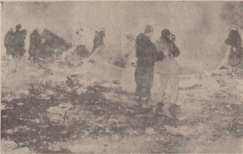
Iš Hong Kongo į Tokiją atskridęs kanadietiškas lėktuvas sudužo. Nelaimės metu žuvo 62 keleiviai. Oras buvo labai blogas, nesimantė nusileidimo vietos. Rasti sužeisti, bet gyvi 9 keleiviai.