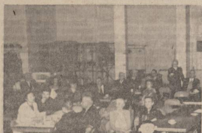
Grupelė kultūringai nusiteikusių lietuvių Alvudo surengtuose Dvasinės Sveikatos kursuose.