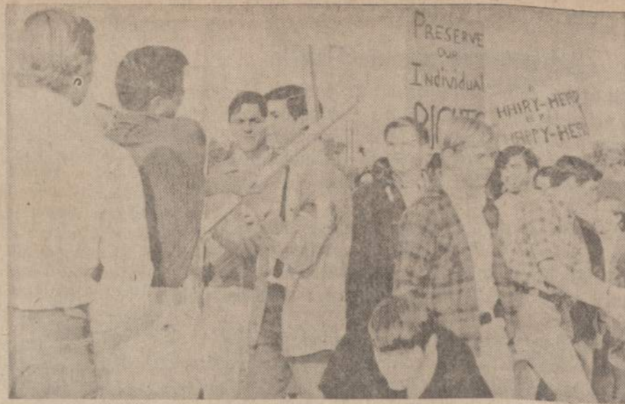
Kalifornijoje, Pacific Palisades mokykloje, susikirto ilgaplaukiai mokiniai su trumpai kirptais. Ilgaplaukiai yra įsitikinę, kad jie daug laimingesni, jeigu jiems leidžiama mokytis ilgesniais plaukais. Ju obalsis plakatuose šaip skamba: "Ilgaplaukė kaiminė yra laiminga kaiminė!" Mokyklos vadovybė reikalauja gražiai nusikirpti ir visuomet susukuoti plaukus.

Tėvui mirus, Ševčenko pagėgo nuo pamotės, bet pakliuvo į nemaziau žiaurios giriuoklio "djako" (kaimo parap. mokyklos vadinamojo mokytojo) rankas. Negalėdamas iškentėti žiauriai priekabingo, nuolat girdo "djako" mušimų. Ševčenko iš savo gimtojo kaimo Kirilivci (Zvenygorodo apskr., netoli Ukrainos sostinės Kievo) pabėgė į netolimą miestelį Lysianka, bet ir čia žiaurus likimas jo neapleidžia — pakliūva į kito, dar žiauresnio "djako" rankas.