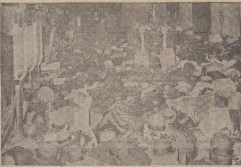
Vienamo New Yorko hotelyje vyko konvencija, kuriai suvažiavo 2.500 atstovų ir svečių. Hotelio vedovybė neturėjo kur pakabinti suvažiuosiu draubuzius. Juos sudėjo greta buvusioje mazonėje salėje. Kilo didžiausia maištatis, kai patarnautojams reikėjo atiduoti apie 10,000 įvairių draubuzių, skrybių ir portfelį.

"NAUJIENOS" KIEKVIENAM ANNO ŽMOGAUS NAUGAS IR BICIULIS