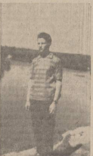
Jaunas lietuvis Lietuvoje prie šuvis upės, Kėdainių apskrityje.

Elastiniai bintai taip pat galima panaudoti. Taip vadinamas