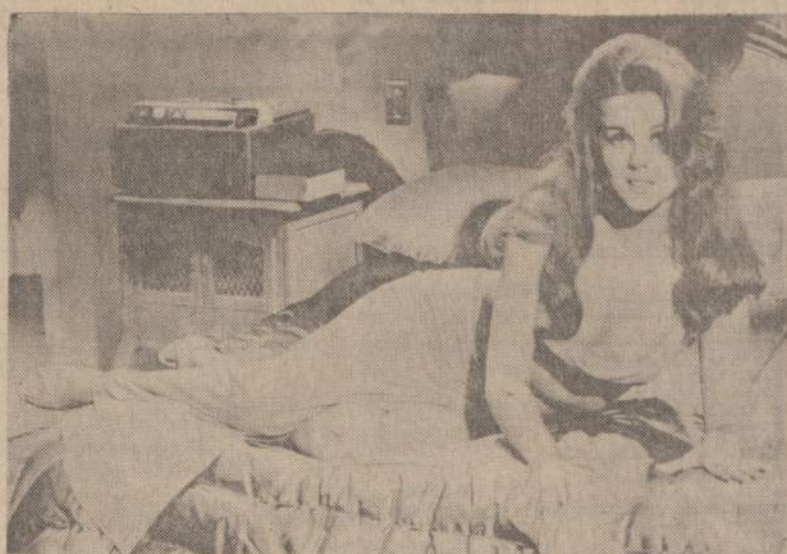
Antrojo Pasaulinio karo metu kareiviai labiausiai mėgo Marilyn Monroe. Jos paveikslą nešiojo kiekvienos kuopos kariai. Vietnami kariai pamėgo paveikslą matoma artistė Ann Margaret. Jos dainos ir vaidyba kariams labiausiai patinka.

1938 m. buvusiam vienuolynei buvo įsteigtas politinių kalininių kalėjimas-isoliatorius, kuris