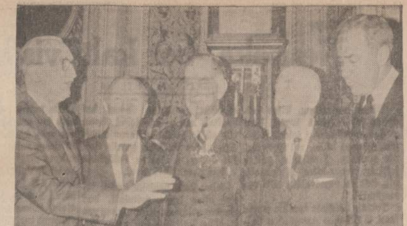
Penki senatoriai norėjo atšaukti kongreso rezoliuciją, kuri leidžia prezidentui siųsti Amerikos karą į Jėgą į Tonkino įlanką. Iš kairės į dešinę stovi: sen. Wayne Morse, sen. Stephen Young, sen. J. W. Fulbright, sen. Ernest Gruening ir sen. Eugene McCarthy. Sen. Morse patarė senatoriams neskirti pinigų Vietnamo kovoms, už jo pasiūlyma balsavo tikiai sen. Gruening. 92 senatoriai balsavo už prezidento Johnsono reikalaujamas sumas.