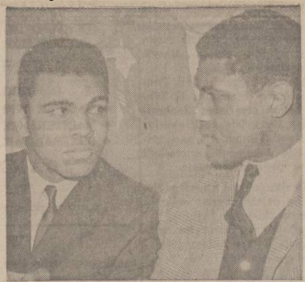
Ernie Terrell atsisakė kumščiuotis su Cassius Clay (kairė), nes pastarasis jau kelis kartus pakeitė kumštynių salygas.