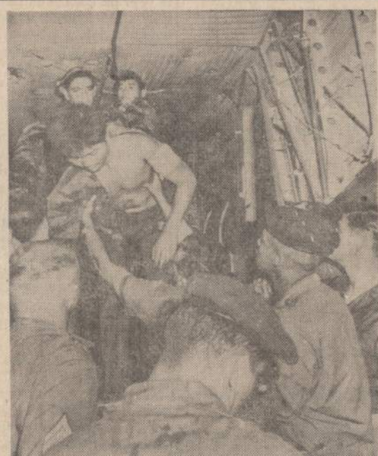
Paskutinę minutę Amerikos helikopteriu pavyko išgelbėti 56 komunistų priešus, drąsiai kovojusius Ashau srityje. Iš helikopterio lipa vienas sužeistas, bet išgelbėtas vietnamietis, drąsiai kovojęs prieš įsiveržusius komunistus. Kovų metu jis buvo sužeistas.

"Kiekvienas turim stengtis įtraukti daugiau ir daugiau amerikiečių į šį reikalą. Kiekvienas turim daryt viską privačiai ir per vyriausybės kanalus, kad šis reikalas būtų iškeltas ir svarstomas Jungtinėse Tautose". (E)