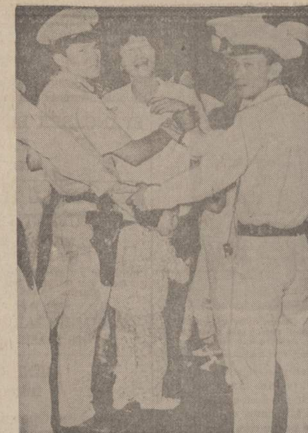
Vietnamo karo teismas nuteisė mirši spekuliantą. Mirties sprendimas įvykdytas. Paveikslė malome spekuliantą žmoną, norėjusią pasiekti vyrą. Vietnamo kariai neleido žmonai ir vaikams pasiekti laudomąjį.

rašo iš Boyce, La. Esą jau du mėne- siai praėjo, kai palikome Ci- cero. Ilgiau buvę sustoję Hot Springs. Ten gerokai pailsėję, patraukė į Texas ir pasiekė Matomoras, Meksikoje. Visą