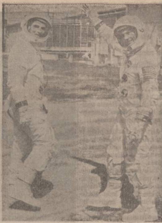
Astronautai David Scott ir Neil Armstrong yra pasirodę skristi į erdvę. Jiedu tikrina Geminį — Agena raketos įrengimus, kad galėtų ją suvaldyti. Jeigu viskas gerai pavyks, tai astronautas Scott išeis iš raketos erdvėn ir bandys pakalnėti iš lauko pusės ir nuvalyti aptrauktus raketos langus stiklus.