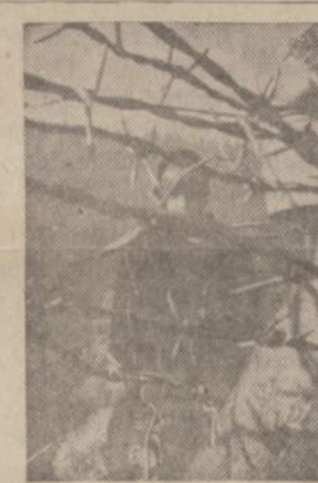
She can't come to you for the truth, but you can reach her.

There are 82 million people like her living inside the Iron Curtain countries of Eastern Europe.