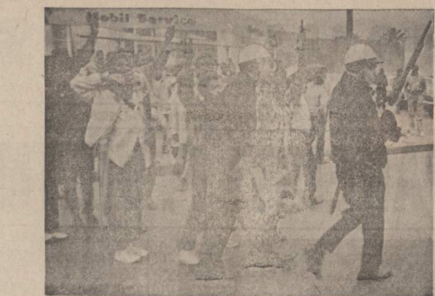
Speciali Los Angeles policija pirmomis riaušiu valandomis suėmė visus triukšmaujančius jaunuolius ir aprašino riaušes. Pavojiskai matome akmenis metėjusius jaunuolius, suimtus nusikaltimo vietoje ir vedamus į policijos automobilį. Buvo suimamas kiekvienas žmogus, kuris nepaklausydavo policijos įsakymo.

Kaip teko patirti, tik du parengimai iki šiol yra išlikę populiarūs ir gausiai publikos lankomi, būtent Vasario 16-tos minėjimai ir Kaukių baliai. Vasario 16-tos minėjimus ruošia Bendruomenė, gi Kaukių balių "Gyvataro" tautinių šokių grupė.