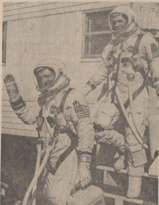
Astronautai Neil Armstrong (kairė) ir David Scott žingsniuoja į erdvėlaivį, kuriuo jiems teko pasikrauti į erdvę ir laimingai nusileisti Netoli Okinavos.

džią turį generolai, matyt, nedrįsta jam pasipriešinti ir paskirti vyriausybę be jo žinios.