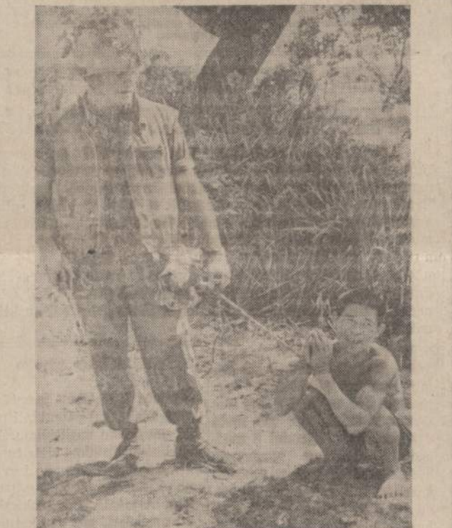
JAV karys laiko viksvose pagautą komunistą. Paskutinės žinios sako, kad kovojančių komunistų nuotaikos krinta. Daugelis meta ginklus ir pasiduoda nelaisvėn. Jiems trūksta maisto, neturi šovinių, o Amerikos lėktuvai juos labai išvargina. Nuo lėktuvų jie negali rasti ramybės.