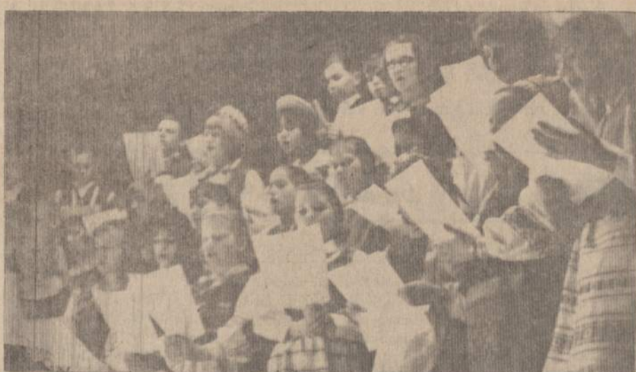
"Aušros" Lituanistikas šeštadieniškos mokyklos choro detalė per pasirodymą 1965 m. Detrote talentų vakare. O dabar su didžiausiu džiaugsmu ruošiasi Dainų šventei.