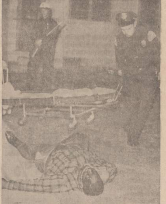
Praeitą trečiadienį Los Angeles negru grupė vėl pradėjo neramumus. Jie užmusė vieną pieno išvežioją baltaodį ir padegė keturis namus. Policija labai greitai numalšino riaušius. Susirėmimo metu užmūsto negro lavoną policija rengiasi vežti į lavoninę.