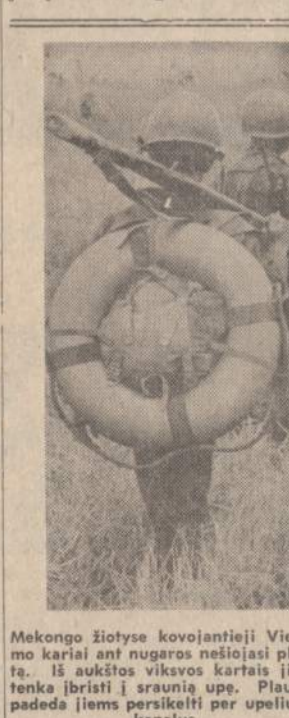
Mekongso žiotyse kovojantieji Vietnamo karaliai ant nugaros nešioja plaukimo. Iš aukštos vikros kartais jiems tenka ibrikti į sraunią upę. Plaustas padeda jiems persikelti per upelius ir kanalus.

Vedusios poros dažnai yra specialiai išskiriamos. Vyrai nušluočiama į Kinijos pietus, o jų žmonos į šiaurę "statyti komunistinio". Gyventojai yra taip propagandos paveikti, kad jie stengiasi klausyti valdžios ir elgtis taip, kaip vyriausybei ir partijai yra naudinga.