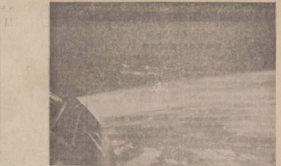
Kovo 16 dieną astronautai Armstrong ir Scott, priartėdami prie erdvėlaivio Agena, nutraukė šią fotografiją.

Maskvos spaudimo dėka, socialdemokratai nuo 1958 metų buvo eliminuojami iš Suomijos valdžios. Tačiau dabar vargiai begalės būtų sudaryta vyriausybė be socialdemokratų, kurie užėmė pirmą vietą seime.