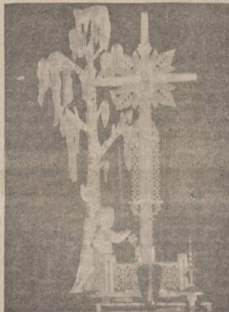
Šis skautų vyčių rankų darbas, 6 pėdų aukščio, buvo vienas iš brangesnių ekspонатų Chicagos Kaziuko Mugėje, parodoje už $85.

Aš esu naujas skiltininkas, turiu naują skiltį. Mano skau-