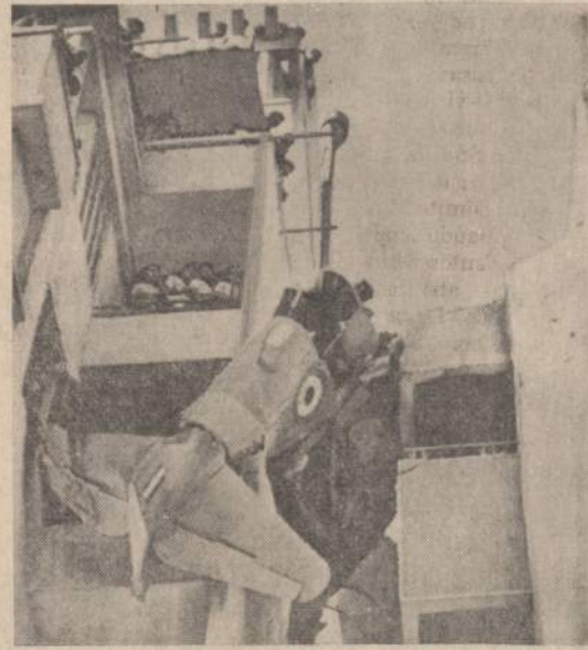
Egipto karo lakūnas, berodydamas žmonėms, kaip jis gali lengvai sukintėti, užkliudę sovietiško "Jako" uodegą už namo ir paliko ją ten. Jis bandė dar nusileisti, bet be uodegos jam nepavyko.

Tikimasi, kad greitai laiku Vatikanas šį klausimą išspręs.