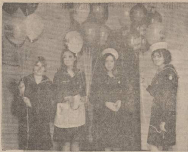
Balionų pardavėjas Kaziuko Mugėje. Chicagos LSS "Juodkrantis" tunto iū- rų skautės laukia mažųjų ir didžiųjų lankytojų.

problema. Dažniausiai drauginin- kai įsivaizduoja, kad jie yra vi- sagalai. Žinai, ką padaryk! Nu- važiuok į stovyklą, kurią naktį paik jė uždarysi knygutę ir pa- slėpki viršininko palapinėje. Kai iš ryto draugininkas atsikels, pa- matysi, kaip švelniai kalbės.