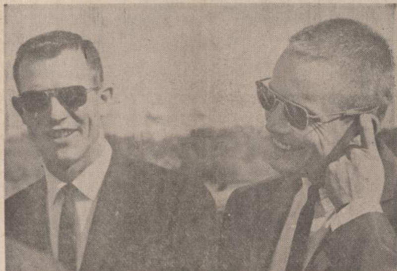
Astronautai David Scott (kairė) ir Neil Armstrong išpasakojo Cape Kennedy pareigūnams apie skridimą erdvėje ir nesuvaldomą erdvėlaivio kraipymąsi, galėjusį nunešti juodu į mirtį. Astronautai nusikridė į Houston, Tex., kad galėtų su savo šeimos nariais pabūti ir papasakoti apie skridimą.

Adenauerio mintis pakartotoji ir Erhardas. Jis savo kalboje praradiją pasakė, kad "tautinis izoliavimas neduoda Europos žmoniems saugumo, tas liečia ir Prancūzija. Užtenka tik prisiminti istoriją, kuri nuvedė Europą į antrąjį pasaulinį karą".