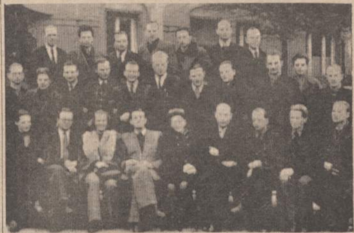
Vienas iš pirmųjų šviesiečių suvažiavimų Vokietijoje.

K. Ostrasko Duobkasiai režisūrai yra gana kietas riešutas. Nežinia, kaip toli režisorius prasilenkė su autoriaus nurodymais, dažnokai išlaipindamas Duobkasių iš duobių. Jei prasilenkė, tai nuopelnas režisoriui, nes tupėti mažose ir nelabai patogiose duobėse ir pilti monologus, ir aktoriui ir publikai būtų kančia. Mizanscenų buvo nuostabiai gražių ir įdomių. Prisiminkim abiejų Duobkasių santykį: iš pradžių jie visiškai skirtingų pasaulių piliečiai, sunkiai ir nenoriai vienas kitą supranta, bet nerimui ir nežinia iškilus, jų tarpe atsirado tikrai žmoniška šiluma. Pvz. abiejų atsisėdimas po užkandžio, ir svarstymas, kas jiems liepė tas duobes kasti. Toliau — Jaunos Moters pasirodymo ir jos šokio metu, kai abu lindi vienoj duobėj, ir abu jaučia keistą neįaukiumą. Vėliau Duobkasio II guodimas galutinai pakrikusį pirmąjį: sustingęs globos gestas, bet toks reikšmingas, toks užuojautos pilnas! Klaidiai prisimena Jaunos Moters puolimas į Duobkasio II glėbį, kada jis nori nuo jos atsipulėti, o kažkokia jėga neleidžia. Bejėgių rankų drebinimas išsakė visą jo siaubą ir vidinę kančią. Arba vėl: kai Duobkasy I prisistato Jaunai Moteriai, jis pilnas pasitenkinimo. (Nukelta į 6-tą psl.)