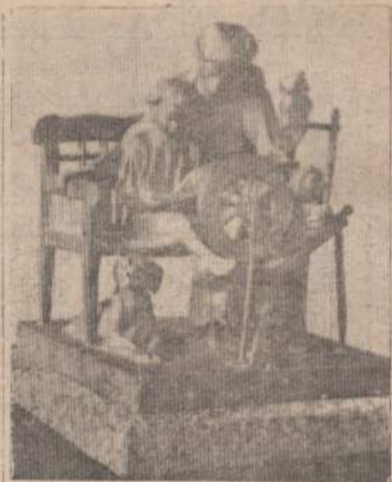
Petras Rimša Vargo Mokykla

Paroda baigsis balandžio mėn. pabaigoje.