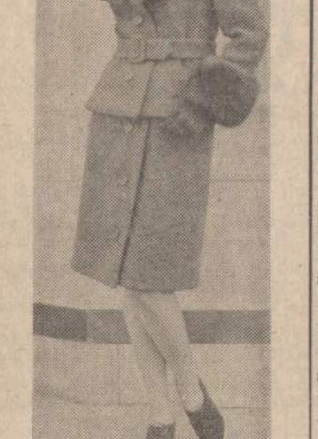
Patį paskutinioji mada jaunoms moterims pasipuosti ši pavasari. Švarkas ir sijonas yra raudonos vilnos.