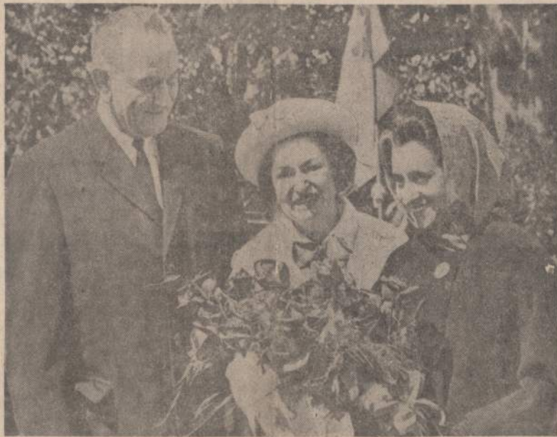
Prezidentas Johnsonas ir jo žmona Washingtone pasitiko Indijos premjerę Indira Gandhi. Viešnia dvi dienas gyvens Baltuosiuose Rūmuose ir farsis su prezidentu įvairiais Indijos reikalais. Ponia Gandhi nori gauti paramos badaujantiems Indijos gyventojams. Indijos pramonė reikalauja paskolos.