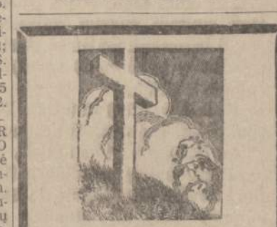
MILLIE ŠIMKUS Pagal tėvus Zimkutė

SKAITYK PATS IR PARAGINK KITOS SKAITYTI NAUJIENAS