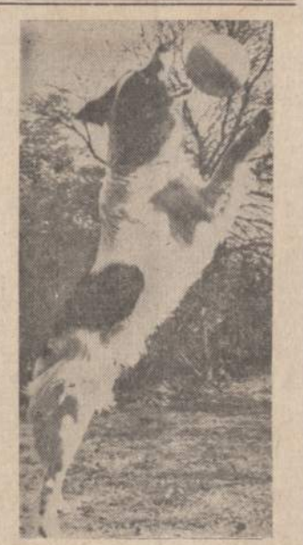
Londonė buvo pavogtas $84,000 dolerių vertas auksinis futbolo trofėjus. Radusiam buvo paskirta $16,800 dolerių premija. Trofėjų surado pavoiskis le matomas šuo Pickle, priklausantis Londono uosto darbininkui. Šuo beuostinėdamas sodo lapuose rado didiką auksco gabalą.