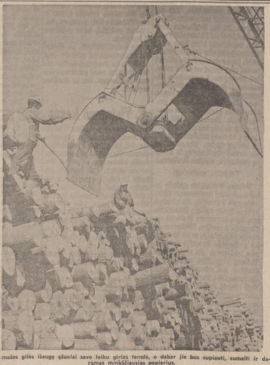
Iš mažos gilės išaugę žuvalai savo laiku girias temdė, o dabar jie bus supiauti, sumalti ir daromas minkčiausias popierius.