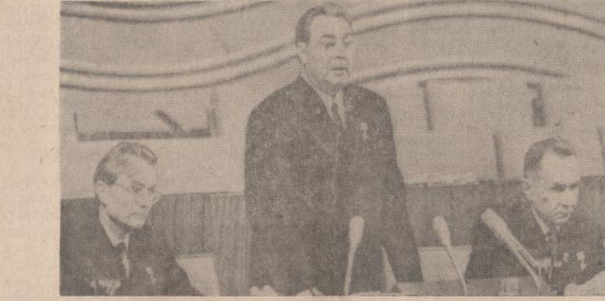
Rusijos komunistų partijos sekretorius Leonidas Brežnevas atidaro kompartijos atstovų suvažiavimą. Dešinėje sėdi premjeras Kosyginas, o kairėje sėdi kompartijos "teoretikas" Michail Suslovas.

bima, kad Brežnevas kongrese ne žodžių neprisiminė Berlyno klausimo.