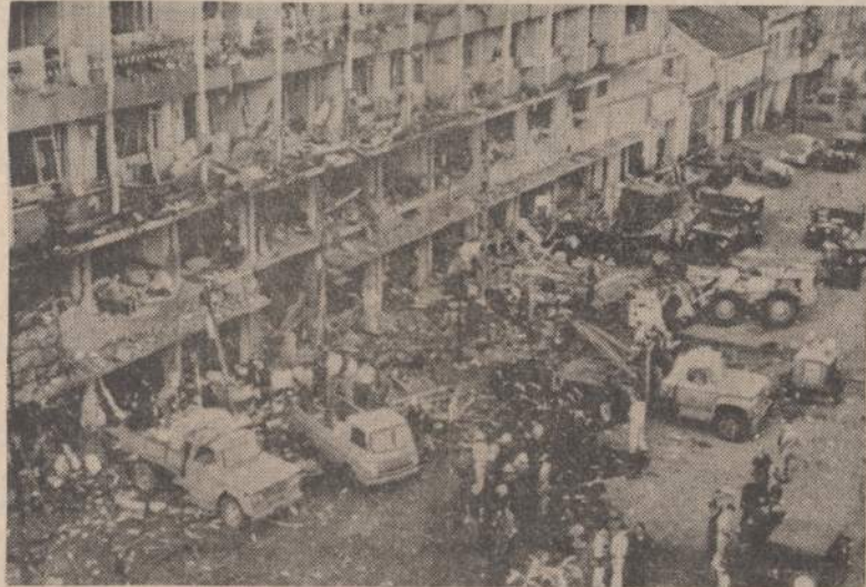
Saigone prie dešimties aukštų viešbučio, kuriame gyveno JAV kariai, privažiavo dinamito pilnas automobilis ir sprogo. Paveikslė matome išgriautas viešbučio sienas ir išdažytus langus.

KAIRAS. — Egipto vyriausybė norėtų gauti iš Amerikos 100 milijonų dolerių paskolą, kuri bus panaudota atominiame vandens nuderkinimo fabriku prie Viduržemio jūros. Be to, Egiptas planuoja statyti visą eilę jėgams sudėti sandėlių-silosų. Dabar dažnai jėgai supilami į kalnus atvirame ore. Čia daug žalos jiems padaro blogas oras ir įvairūs kenkėjai. Trečias projektas, kuriam Egiptui trūksta lėšų yra elektros jėgainės prie Kairo miesto praplėtimas. Jėgainę stato amerikiečių bendrovė Westinghouse Electric.