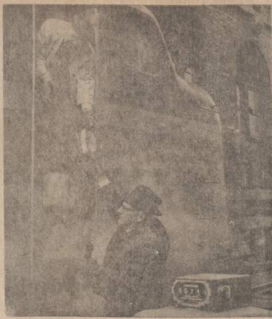
Pennsylvanijos kelevinis traukinys, atėjęs į Pittsburghą, Pa., sustoja. Geležinkelio pečkūriams susitikavus, konduktorius turėjo vykti į Altoona ir atvežti į Pittsburghą ten streikininkų paliktą kelevinį traukinį.

4071 ARCHER AVENUE — CHICAGO, ILLINOIS 60632 Valandos: pirmad., antrad., penktad. 9:00 r. — 4:30 po pietų; trečiadieniais uždaryta; ketvirtad. 9:00 r. — 8:00 val. vak.