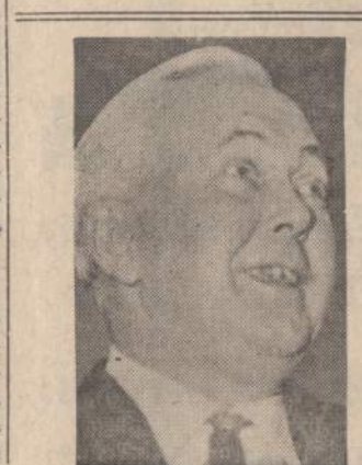
Britų premjeras Harold Wilson (kairėj), laimėjęs rinkimus, ir britų konservatorių vadas Edward Heath, pralaimėjęs rinkimus.

Dėl rūkymo trys milijonai žmonių negali dirbti pilno darbo, o 900,000 žmonių rūkymo rezultate ilgesnį laiką serga ilgesnį laiką gulėdami ligoninėje ar namie.