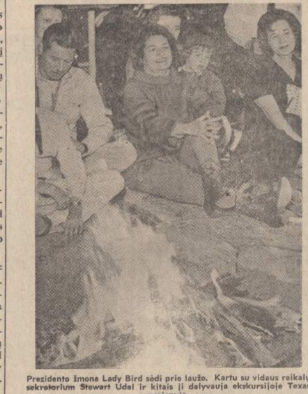
Prezidento žmona Lady Bird sėdi prie lauko. Kartu su vidaus reikalų sekretorium Stewart Udali ir kitais ji dalyvauja ekskursijoje Texas pasienyje.

Pietų Afrikos premjeras Verwoerd pareiškė užvakar, kad P. Afrikai yra svarbus tik dviejų pasaulio valstybių nusistatymas jos atžvilgiu — Amerikos ir Britanijos. Premjeras pridėjo, kad jos neprivers P. Afrikos nusilenkti tarptautiniam spaudimui. Pietų Afrika remis Rodeziją ir nepaaukos savo principu. Jei Britanija ir Amerika pradės prieš Pietų Afriką kokią neprotingą akciją, tai tik pačios nukentės, pareiškė Verwoerd.