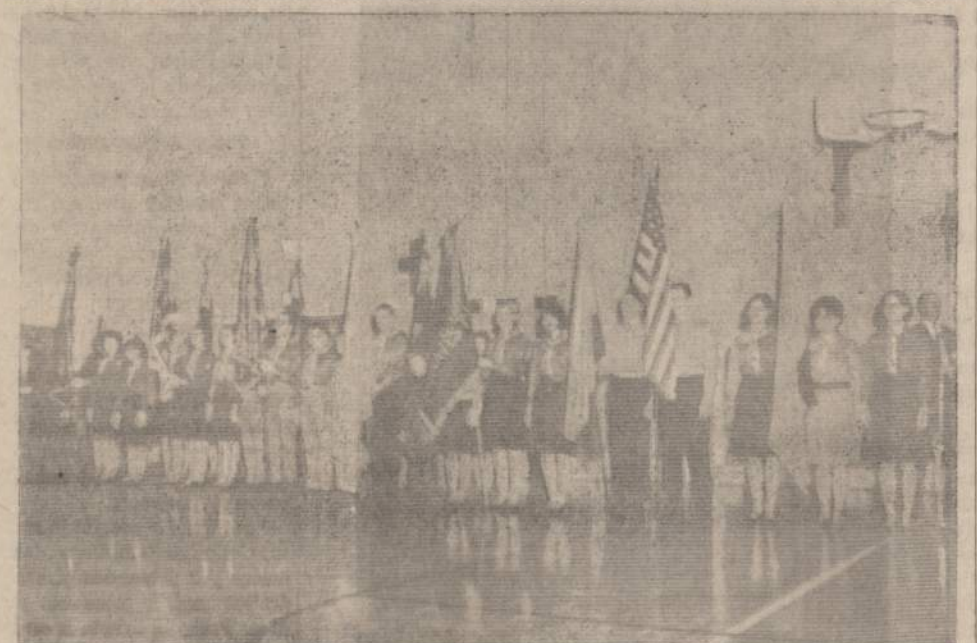
Pasaulio skautu Globėjo žv. Jurgio šventei besiruošiant, čia matome Chicago skautų ir skaučių vienetų vėliavas 1965 m. žv. Jurgio sueigoje Bogan mokyklos salėje. Šiomet jungtinė visų runtų sueiga irgi įvyks ten pat (79 ir Pulaski gatvių kampe) balandžio 24 dieną.

NAUJIENOS 1739 So. Halsted Street Chicago 8, Illinois