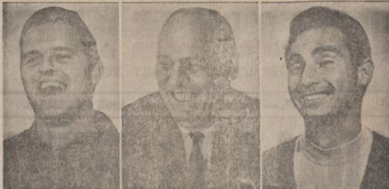
Sportininkai Don Drysdale ir Sandy Koufax pasirašė $230,000 sutartį su viduryje maţomu Los Angeles Dodgers menadţeriu Buzie Bavasi.