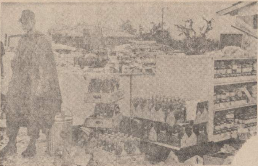
Floriadoje riauusi sudra igriove daug namu ir padare dideliu nuostoliu. Paveiksle matome vietos kariu, saugojancius igriautos krautuves produktus.