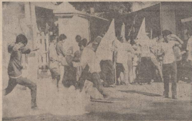
Saigone policija paleido asarinių dujų bombą demonstruojančius studentus. Vienas jaunuolis išmestą bombą koja paspyrė tolyn, o kiti nekreipia į ją jokio dėmesio.

Įsistiprinusi prie Raudonosios jūros Sovietų Sąjunga lengvai galėtų kontroliuoti visa žibalo tiekiamą iš Persijos įlankos. Karo atveju šitokia kontrolė būtų pragaistinga Vakarų pasauliui.