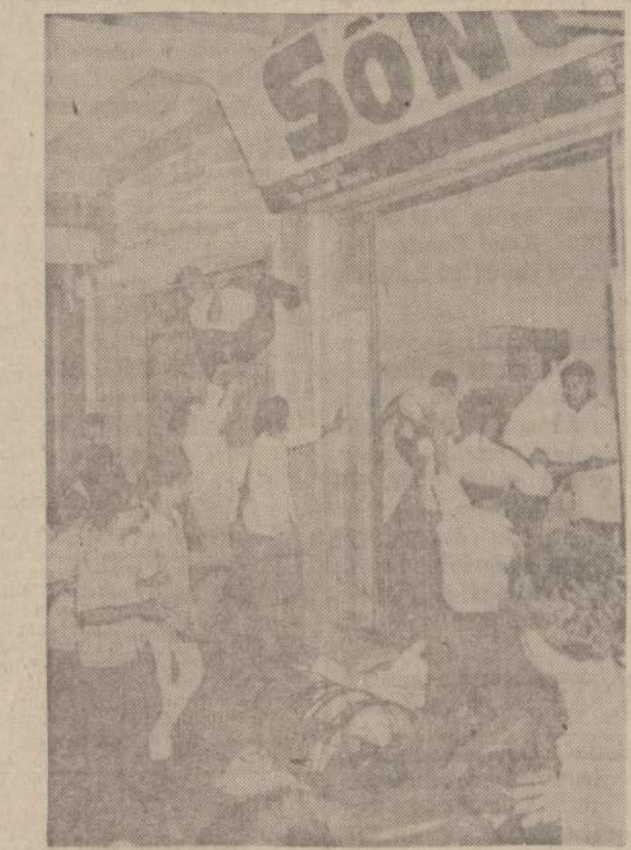
Saigone ėjo laikraštis, kuris negyė premjero Ky valdžios, bet pa- smerkė beprasmes studentų demonstracijas. Studentai įsiveržė į mi- nėto laikraščio redakciją, išdaužė langus, sumaišė raides ir padarė daug nuostolių. Paveikslė matome siaučiančius Saigono studentus.