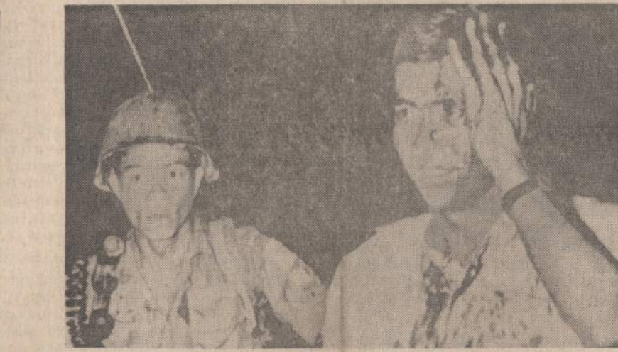
Maža budistų grupė pradėjo kurstyti jaunos Vietnamo studentus kelti riešus ir organizuoti protestus prieš dabartinę vyriausybę. Premjeras Ky įsakė kariams suvaldyti triukšmadarius. Paieško matome Vietnamo karį, vedantį policininko jau apkultą triukšmadarį.