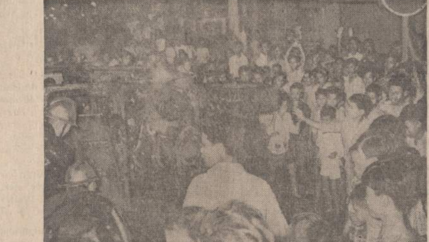
Saigone budistų sukurstyti jaunuoliai padegė JAV karių automobilį, o vėliau apinkui jį šoko. 3 beginklius Amerikos karius gerokai apdaužė. Budistai reikalauja, kad dabartinis premjeras atsistatydintų ir atiduotų valdžią civiliams.

Izraelio diplomatai, neseniai prasidėjusiu kultūrinio santykiams nelabai džiaugiasi. Jie sako, kad sovietai siunčia savo muzikus į Izraelį, tačiau savo tankus ir lėktuvus — į Egiptą.