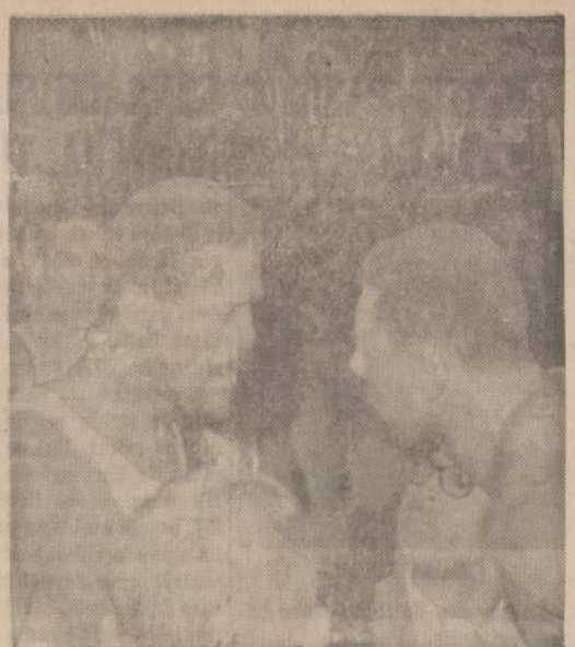
Bostono rungtynių metu susiginėjo, o vėliau ir kumčių smūgiais paskelbė sportininkai Bill Russell ir Wilt Chamberlain. Susirinkę į Boston Gardens žiūrovai, imituodami sportininkus, taip pat pradėjo vienas kitam antausius skaldyti. Policija nepajėgė sustabdyti sustabdyti.