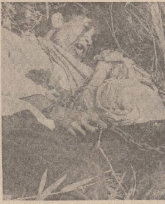
Vietnamo komunistai laikė balose supančiuotus ir sukaustytus 25 civilinius gyventojus. Kai jiems reikėjo bėgti, tai paleido į supančiuotus kulkosvaidžius. Daugumą išžudė, bet trys resti dar gyvi, nors ir sunkiai sužeisti.