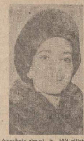
Amerikoje gimusi ir JAV pilietybę turinti operos solistė Maria Callas, bekovodama su savo vyru Gianni Menighini, greitesnių skrybių sumeti-mais atsisakė JAV pilietybės ir priė-mė graikų pilietybę.