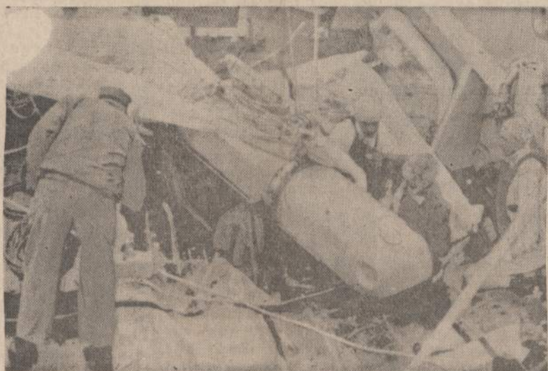
Iš Viduržemio jūros 2,500 pėdų gilumos ištraukta JAV atominė bomba. Susidūrus dvim lėktuvams Palomares srityje, viena bomba įkrito į vandenį. Ją ištraukė praeitą savaitę ir parodė laikraštiniams.

tvarką. To dėka buvo išvengta panikos, dėl kurios dažnai žūva daug žmonių.