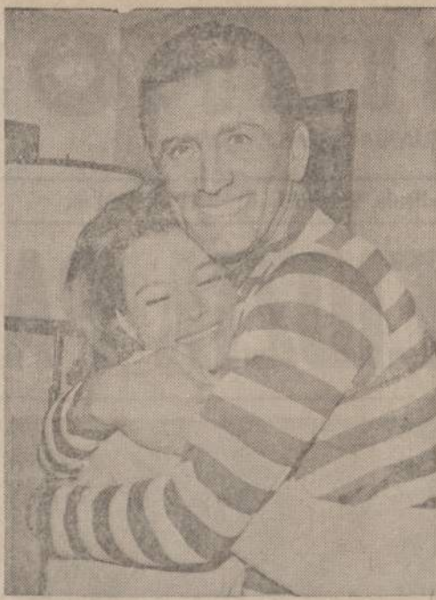
Kino aktorius Kirk Douglas į visus filmus įdeda daug jausmo, kaip galima tai matyti šioje scenoje su aktorė Angie Dickinson.

Naujienu administracija turi daug gražių ir nebrangių knygų, kurias galima tik už kelis dolerius įsigyti. Knyga yra geriausias žmogaus draugas, tad ir Tamsta įsigyk bent keletą tokių draugų.