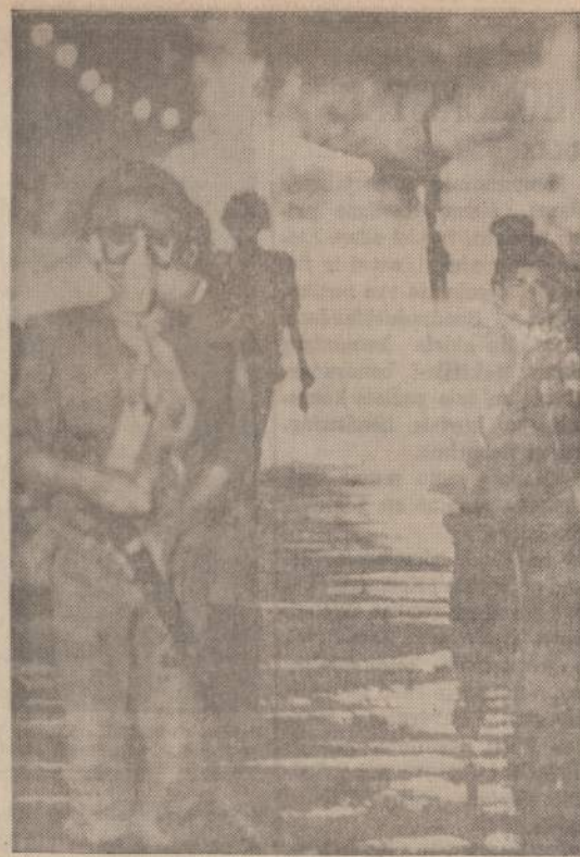
Nakties vaizdas šiuo dienu Vietnamo sostinėje Saigone. Sargybas einantieji kariai turi dėvėti maskas, kad apsaugotų nuo dujų. Budistų grupė kursto jaunuolius kelti nerimą, kad būtų nuversta dabartinė Vietnamo valdžia.