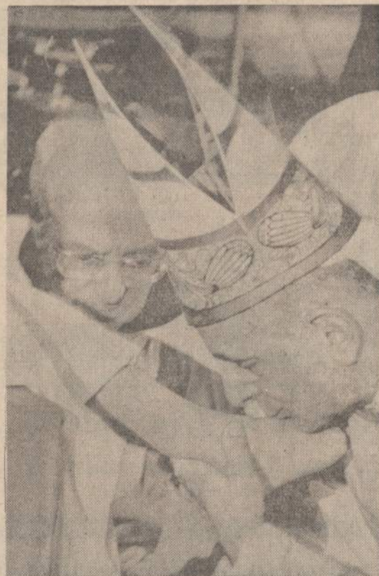
Kristus nuplovė kojas savo apaštalam. Dabartinis popiežius Paulius VI bučiuoja nuplautą koją aklų 12 metų berniuko.

Debatuose paaiškėjo, kad žibala į Rodeziją gabenti buvo specialiai sudaryta bendrovė iš graikų, Pietų Afrikos bendrovės ir Rodezijos. Ši bendrovė įsigijusi 9 tanklaivius, kurie visi pakeitė savo vardus atviroje jūroje, buvo perdažyti ir perregistruoti, kad pasunkinus sekimą. Laivų uždavins buvo gabenti žibala Rodezijon. Manoma, kad, priėmus šią rezoluciją, laivų savininkai dabar bijos rizikuoti.