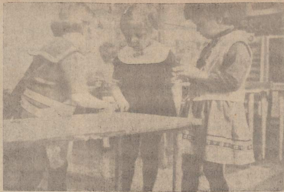
Ateities darbščiosios šeiminiųkės domisi švara. Amerikos Lietuvių Montessori Draugijos Vaiku Namelių mokinukai mokosi tvarkingai plauti stalą.

b) Tokie pasikalbėjimai būtų nebet tada negarbingi, jei tas Sovietų atsiųstasis valdininkas