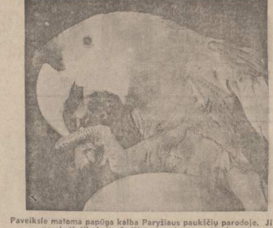
Paveiksle matoma papūga kalba Paryžiaus paukščių parodoje. Ji gali pasakyti tik kelis žodžius, bet juos nuolat kartoja.

Tai sveika dieta. Tik vieną dalyką čia reikia pastebėti — negalima jos savamoksliskai prisilaikyti, pirm su gydytoju nepasitarus. Mat, gali žmogus sirgti rėškia ar užsislėpusia podagra (gout). Tada tokiame žmogui jūros gyvių maistas bus kaip nuodas. Už tai kiekvienas pajėgus gydytojas pirm patikrina žmogaus kraujyje esamą šlapumo rūgšties (uric acid) kiekį. Jis laikomas normaliu nuo 3,8 iki 7,1 mg.% tiriant kraują. Po ištyrimo, jei galima, gydytojas pa-