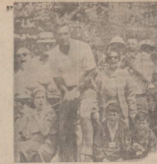
Augusta, Ga., laukuose piknikavo vadinama Arnie's Army. Jie žaidė, dainavo ir golfą lošė. Svarbiausias jų tikslas — džiaugtis kiekviena gražia diena.

Nepriklausomos partijos sumanytojai ketina šaukti konservatorių suvažiavimą.