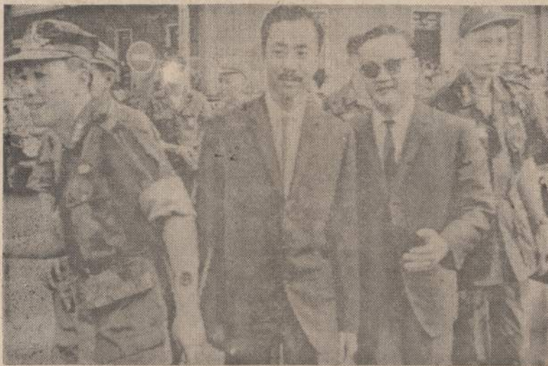
Vietnamo premjeras Nguyen Cao Ky ir valstybės prezidentas Nguyen Van Thieu vyksta į veikėjų pasitarimą tolimesniems valstybės reikalų dalykams nustatyti. Abu pareiškė, kad kariai nori perduoti vyriausybę civiliams, bet perdavimo procesas turi būti tvarkingas. Turi būti iš anksto nustatyta rinkimų tvarka.