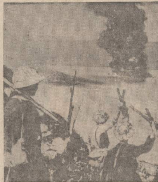
Šiaurės Vietnamo komunistai paskelbė šią fotografiją. Jie tvirtina, kad Nghe An provincijoje pakraščiu apsaugos kariams pavyko nu-mušti paveiktą matomą Amerikos lėktuvą.