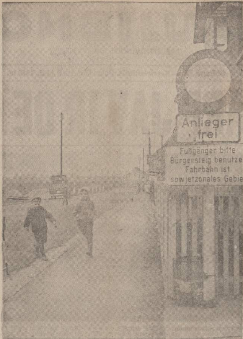
Vokietijoje, Obershul miestelyje, siena eina viduryje gatvės. Vaikai, nekrepdami dėmesio į iškabas, kartais įkelia koją į sovietų zoną, bet paskubomis vėl bėga į savo pusę.