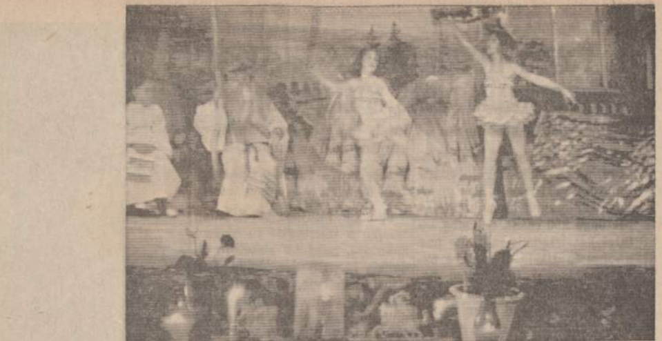
Baletmeisterio Simo Velbasio Baletu studijos mokinės išpildo programą Vasario 16 d. šventėj Marquette Parke, stebint scenoje Vaidilai su vaidilutėmis. Priekyje — lietuviški ženklai papuošto aplinkoj.

Štai kodel juodu tapo suareštuoti, kaip kokie kriminalistai. Pritarimas despotizmui Mizaros ir Bimbos redaguojamas laikraštis jų suareštavimui pilnai pritaria. "Laisvė" juos smerkia už tai, kad 1) juodu siuntė raštus "Tarybų Ukrainos priešams"; kad juodu (2) darė tai slaptai; kad juodu (3) "niekino" tarybinę san-