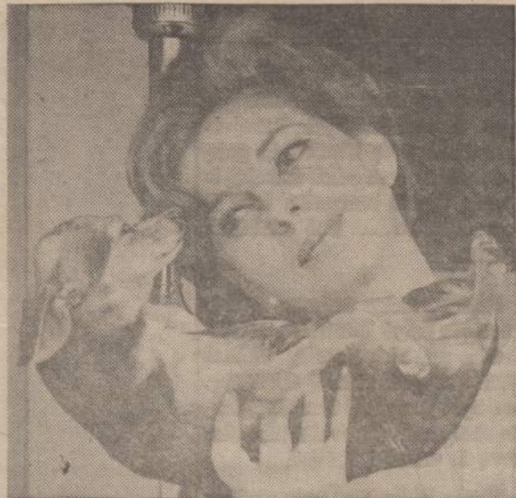
Gražioji Abbe Lane turi nepaprastai gražias akis, bet pastaruoju metu ji žiūri tiktai į savo šunytį Pasquiline. Šunytis nežino, koks jis turi būti laimingas, turėdamas progos išmatuoti tokias gražias akis.

— Ta-aip, jums tai sunku! — isitikinęs tarė kareivis, įdėmiai žiūrėdamas į mus. — Jūs