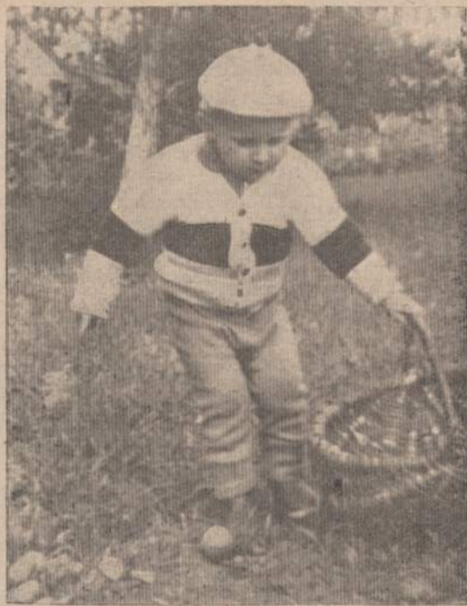
Mažas Gintautas netinginiauja