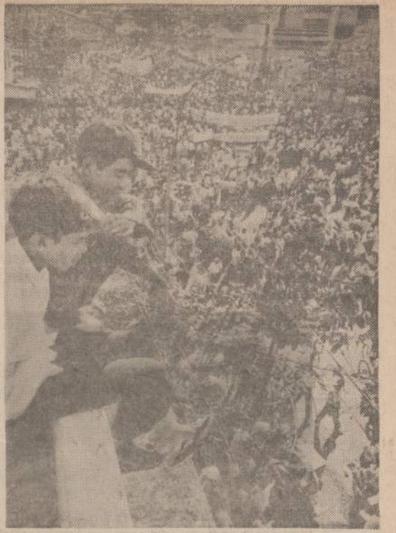
Saugene vaikai nuo stogo žūri budistų demonstracija. Premjeras Cao Ky pasižadėjo praveisti rinkimus penkių mėnesių laikotarpyje. Kariai atiduos valdžią žmonių rinktiems atstovams.