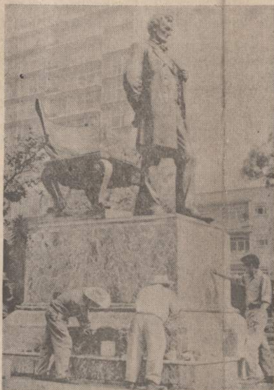
Meksikos sostinėje atidengtas paminklas Abraham Lincolnui. Tai amerikiečių dovana meksikiečiams. Į paminklo atidengimo iškilmės buvo nuvykęs prezidentas Johnsonas su žmona. Darbininkai baigia paminklo statybos darbą.

Saigone policija susekė komunistų šnipų lizdą, kuriam vadovavo dvi gražios, jaunos vietnamietės. Jos ne tik parūpindavo Viet Congui transporto laivai buvo iškraunami, o 9 laukė savo eilės uoste. Padėtis yra visai patenkama, tvirtino Vance. Bombų klausimas irgi yra opozicijos perdardamas. Dėl jų trūkumo neteko sumažinti puolimų. Šių metų bendras bombų kiekis yra numatytas 600,000 tonų. Tas skaičius sudaro 91% visų Korėjos kare