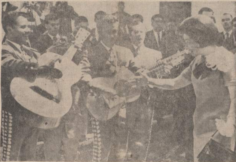
Prezidento Johnsono žmona, atidengusi Abrahamo Lincolno paminklą Meksikos sostinėje, išvažiuo į Chapingo, kad pamatytų, kaip meksikiečiai tvarko žemės ūkį. Tvirtinama, kad Chapingo srityje yra pats geriausias ūkis pietų Amerikoje.

Žydų reikalavimus parėmė ir Amerikos senatoriai. Net 69 senatoriai pasirašė raštą reikalaujanti trims milijonams sovietų žydų daugiau laisvės ir pabrėždami, kad kol jų teisių žydai negaus, protesto balsai nesustos. Senatoriai reikalauja, kad sovietai leistų tiems savo piliečiams, kurie nori, emigruoti į užsienį.