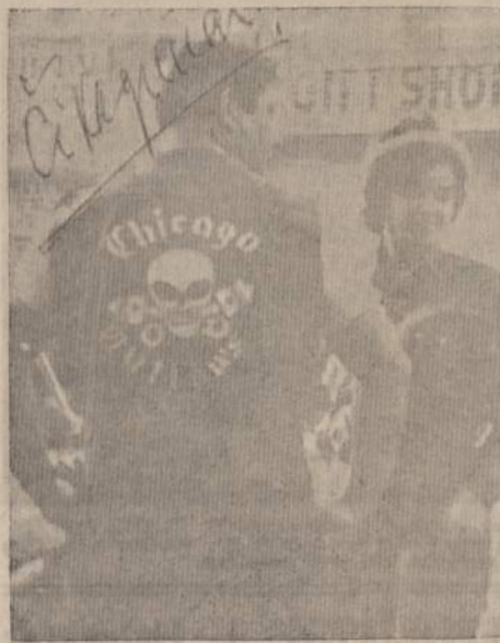
"Lakudra" su "pragaro angelu"

Prisiklausę iš laikraščių ir radijo apie paauglių (universitetų studentų ir mokyklų pabirų — dropouts) nuostolingas riaušes kitur, ypač Massachusetts paplūdimiuose ir Kalifornijoje, ramybę ir poilsį mėgstantieji floridiečiai pradėjo ausimis karpyti iš tos pačios spaudos ir radijo išgirde, kad Florida šiemet greisia invazija — nebe iš ispanų