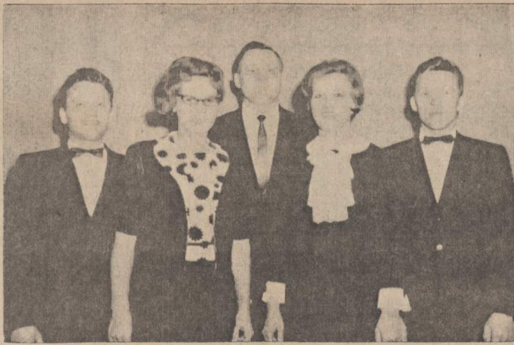
Omahos Lietuvių Bendruomenės choro dabartinė valdyba

1951 m. chorą sustiprina tautinių šokių būrelis, savas jėgas įpindamas į choro sudėtį. Savo sėkmingą darbą tęsia iki 1954 metų ir per tą laiką duoda 24 viešus koncertus. Pagaliau tu pačių 1954 m. vasario 4 d. į chorą atskuba ir scenos mėgėjų būrelis. Vyrai, jau nebejuoska! Daina, teatras ir tautiniai