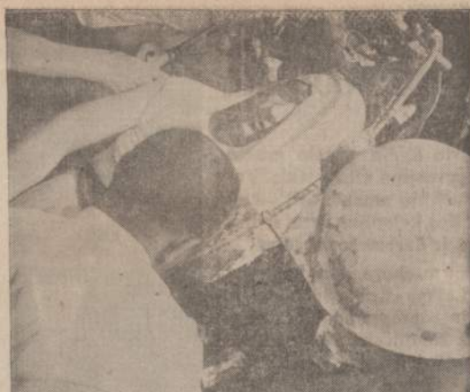
Trenton, Ga., oloje įvyko sprogimas, kurio metu žuvo vienas skautas ir du gelbėtojai. Vietos skautai dažnai mēgdavo tyrinėti Trenton olas. Ekskursijos metu užtiktas gasas, įvykus sprogimui, vienas skautas užmuštas. Nukentėjo ir antrasis, bet gydytojams pavyko jį atgaivinti. Nolaimes vieton atskubėjo du specialistai, norėdami padėti skautams, bet ir jiedu žuvo.

Pačios Rusijos "komunistinė" valdžia nutarė pertvarkyti savo pramonę kapitalistiniais pagrindais. Į ją įms veržtis ir užsienų kapitalas, kai tik tenai bus geriau paruošta jo augimui dirva.